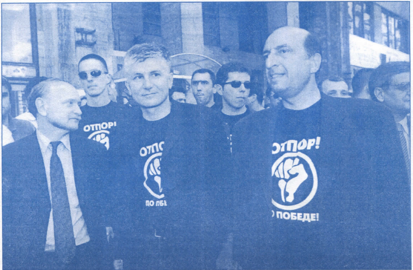
Они програме Владе пишу у немачким и америчким кабинетима, иако то народ није хтео

Дакле, досовизија нас кљука разнора- зним неистинама, лажним причама.