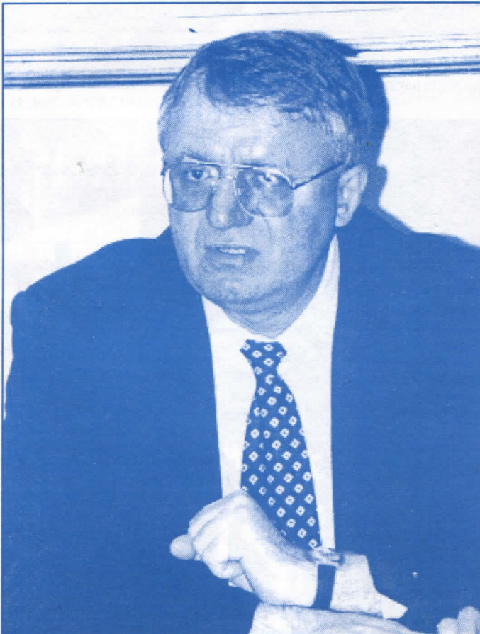
Др Војислав Шешељ: Мудрост, знање и поштење