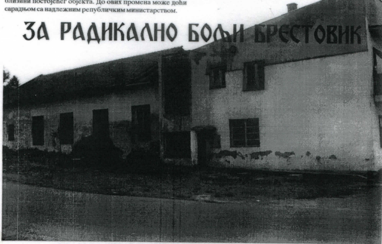
Некада зграда за углед, сада тужни доказ небриге и немара дом културе у Брестовику