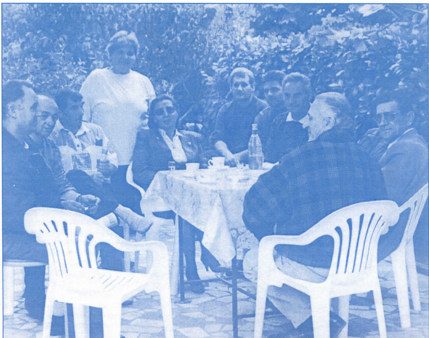
Српски радикали брину о својим грађанима: радни договор кандидата и активиста Српске радикалне странке

Бирајмо најбоље! Србија је вечна док су јој деца верна! Чист образ српских радикала!