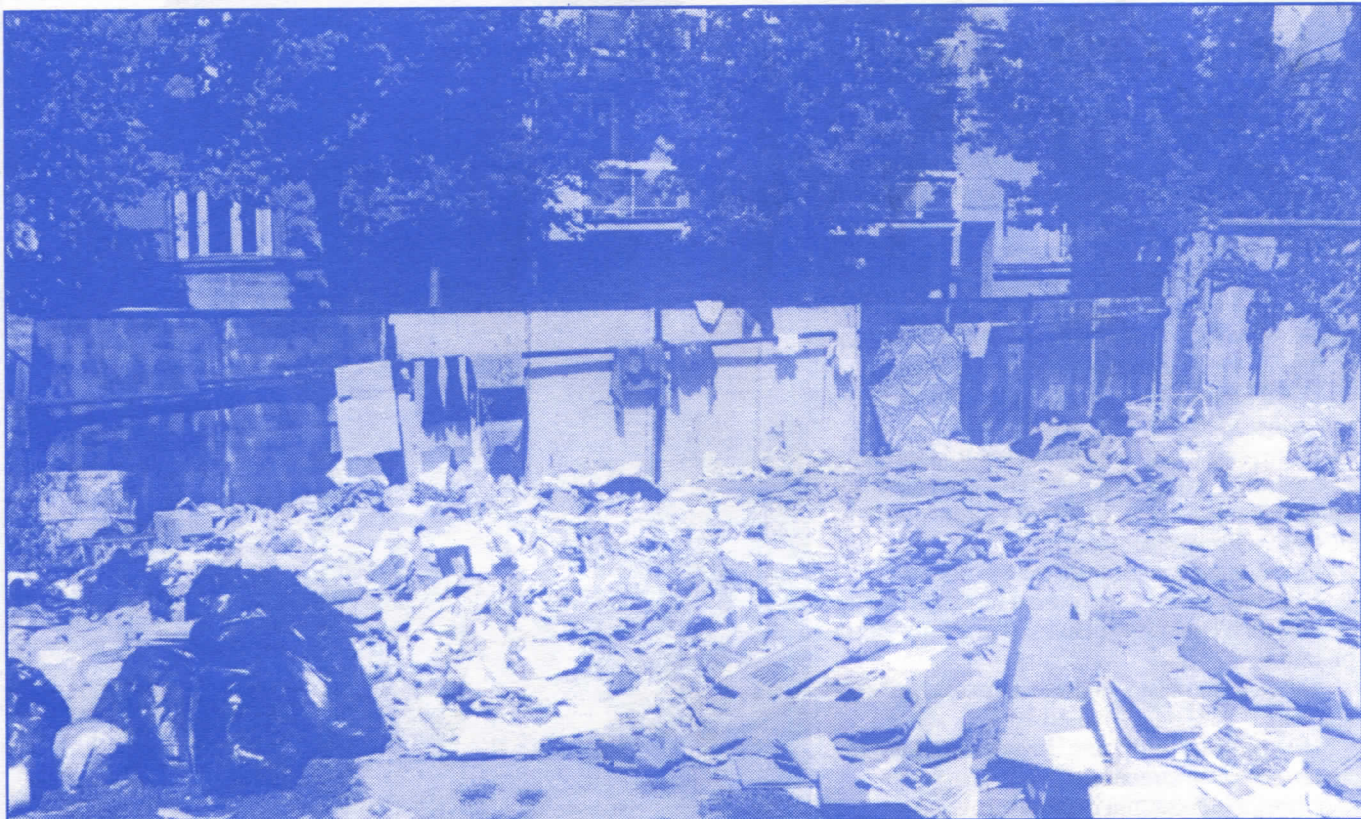
Досадашња власт на Врачару је показала да је најлакше рушити

Председник општине и сви одборници мораће да буду у сталном контакту са грађанима и да непрестано изналазе начине да им, колико је то у њиховој моћи, помогну, а не да после избора изгубе сваки контакт са њима и