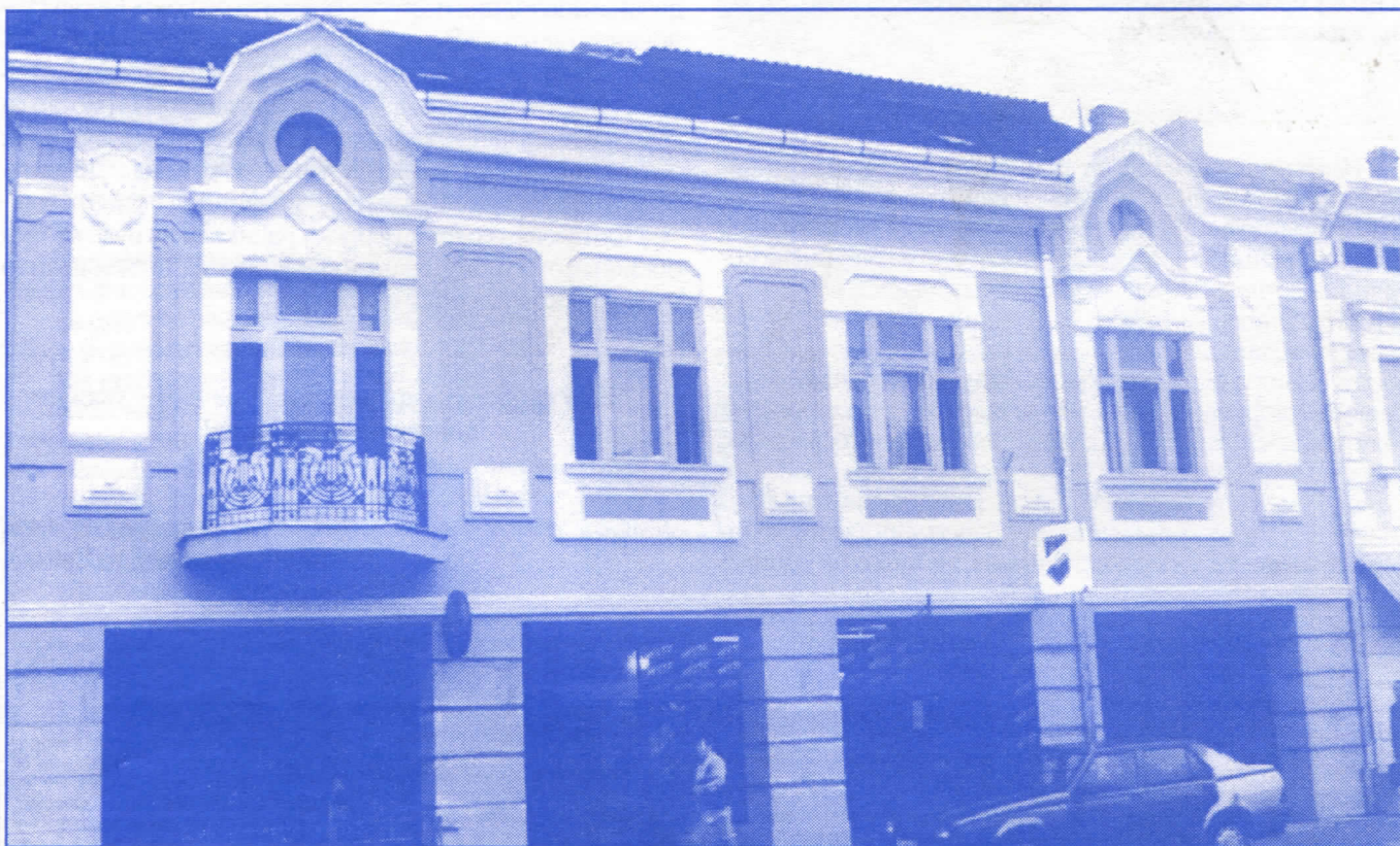
Радикалска власт у Земуну је доказала да способни граде

Без обзира на то што је санирање постојећих и изградња нових улица у надлежности Скупштине града, српски радикали на Врачару, поучени бројним примерима из општине Земун, сигурно ће наћи потребна финансијска средства да поправе све улице и тротоаре на територији општине. Чистији ваздух и већа безбедност грађана омогућиће се краћим задржавањем возила која кроз подручје општине пролазе за насеља Шумице, Браће Јер-