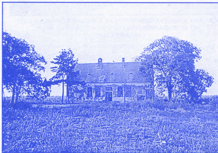
НАПУШТЕНИ САЛАШ - СЛИКА КОЈУ ТРЕБА УЧИНТИ РЕТКОМ, ПОБОЉШАЊЕМ УСЛОВА ЖИВОТА НА СЕЛУ

овим МЗ живе у великом броју. Општина, очито, занемарује чињеницу да се велики број наших суграђана изјашњава као Буњевци и не налази за сходно да им обезбеди адекватан простор у јавном информисању. Буњевци немају могућност да у медијима чији је оснивач СО Суботица (Радио Суботица, Суботичке новине)