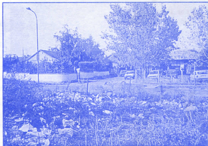
М.З. КЕР - ДИВЉА ДЕПониЈА КАО ДОКАЗ НЕМАРНОСТИ ОДГОВОРНИХ ЉУДИ У ГРАДУ

А водила је општинска власт политику и то врло озбиљну, само не комуналну него спољну. Трчали су по белом свету и „своје” кудили а