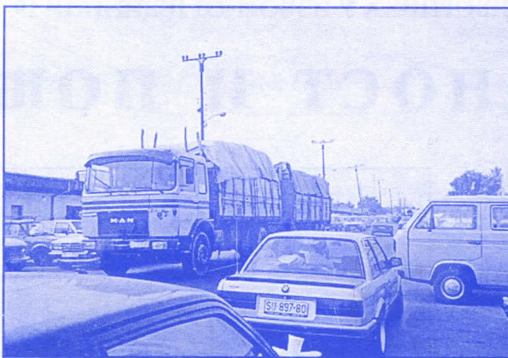
МАЛИ БАЈМОК - САОБРАЋАЈ ОКО ТРЖНИЦЕ (БУВЉЕ ПИЈАЦЕ) НАЈЧЕШЋЕ ЈЕ СКРОЗ БЛОКИРАН

на овај начин могуће доказују и избори из 1997. године а да ли ће промене овога бити још радикалније зависи управо од Вас, грађана.