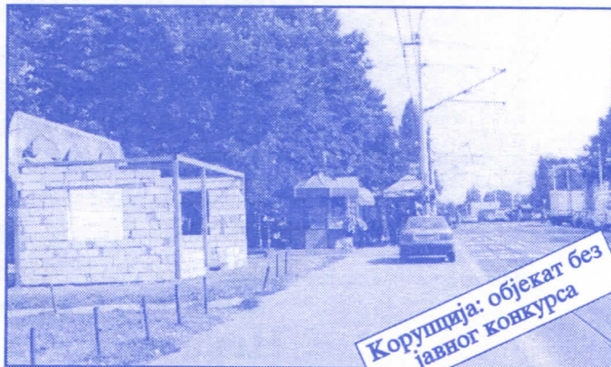
Корупција: објекат без јавног конкурса

Општина ће помоћи социјално најугроженије становнике Палилуле. Та помоћ ће имати једнократни карактер. Примат у оваквим акцијама имаће деца без родитеља, деца палих бораца, инвалиди последњег рата, стари грађани и физички хендикепирана лица. Организовање овакве помоћи биће обавњено путем конкурса објављеног у општинским новинама (или другим средствима јавног информисања) на који ће моћи да се пријаве сви грађани општине Палилуле.