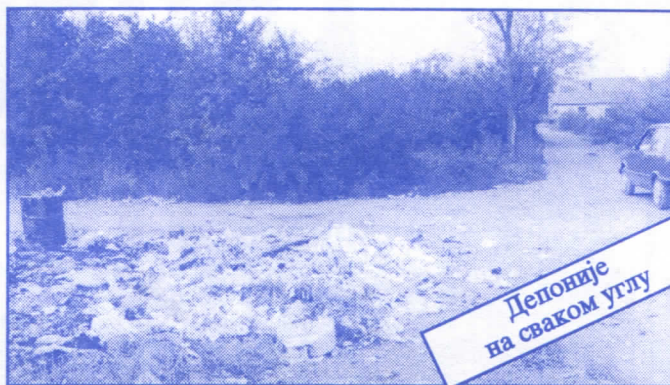
Депоније на сваком углу

• Оснивач и издавач: др Војислав Шешељ • Издање приредио: Општински одбор Српске радикалне странке Палилуле • Главни и одговорни уредник: Синиша Аксентијевић • Заменик главног и одговорног уредника: Душан Весић • Помоћник главног и одговорног уредника: Јасна Олујић Радовановић • Техничко уређење и компјутерски прелом: Бранка Бобић и Саша Радовановић • Лектор: Зорица Илић • Редакција: Момир Марковић, Наташа Јовановић, Јадранка Шешељ, Јана Живљевић, Александар Вучић, Драгољуб Стаменковић, Весна Арсић, Коста Димитријевић, Вељко Дукић, Весна Марић. • Секретар редакције: Љилана Михајловић. • Штампа: „Стебра“ Војни пут блок 2/250ц, Земун