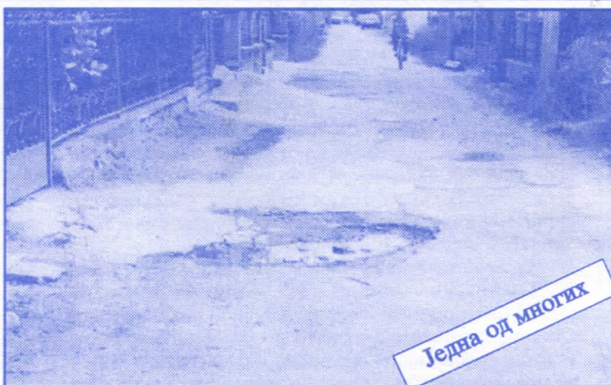
Једна од многих

Подржаваћемо донаторство и спонзорство као вид помагања културним установама. Покренућемо отварање нових огранака библиотека и обезбедити простор за њих (евентуално просторије месних заједница). Обновићемо домове културе у свим приградским насељима.