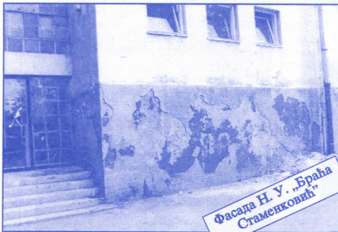
Фасада Н. У. „Браћа Стаменковић“

Преуговарање коришћења пословног простора са свим корисницима и јавно оглашавање издавања неискоришћеног пословног простора. Сви постојећи уговори штетни по Јавно предузеће, типа пазакупа и франшизе, биће одмах раскинути. Преговараћемо са значајним домаћим и страним фирмама око отварања њихових представништва на територији општине Палилула под најповољнијим условима. Смањићемо број корисника који користе простор без накнаде.