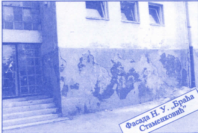
Фасада Н. У. „Браћа Стаменковић“

Грађевинско земљиште које је у општинској својини, понудићемо на лицитацију и под једнаким условима омогућићемо учешће физичким и правним лицима.