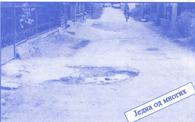
Једна од многих

Подржаваћемо донаторство и спонзорство као вид помагања културним установама. Покренућемо отварање нових огранака библиотека и обезбедити простор за њих (евентуално просторије месних заједница). Обновићемо домове културе у свим приградским насељима.