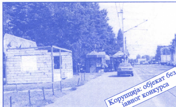
Корупција: објекат без јавног конкурса

Општина ће помоћи социјално најугроженије становнике Палилуле. Та помоћ ће имати једнократни карактер. Примат у оваквим акцијама имаће деца без родитеља, деца палих бораца, инвалиди последњег рата, стари грађани и физички хендикепирана лица. Организовање овакве помоћи биће обављено путем конкурса објављеног у општинским новинама (или другим средствима јавног информисања) на који ће моћи да се пријаве сви грађани општине Палилуле.