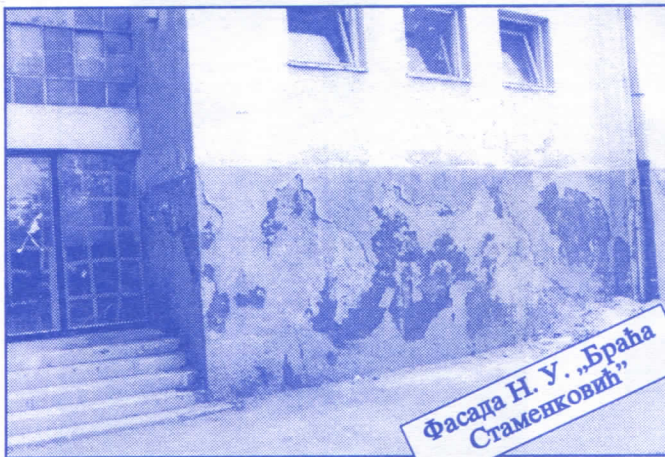
Фасада Н. У. „Браћа Стаменковић“

Грађевинско земљиште које је у општинској својини, понудићемо на лицитацију и под једнаким условима омогућићемо учешће физичким и правним лицима.