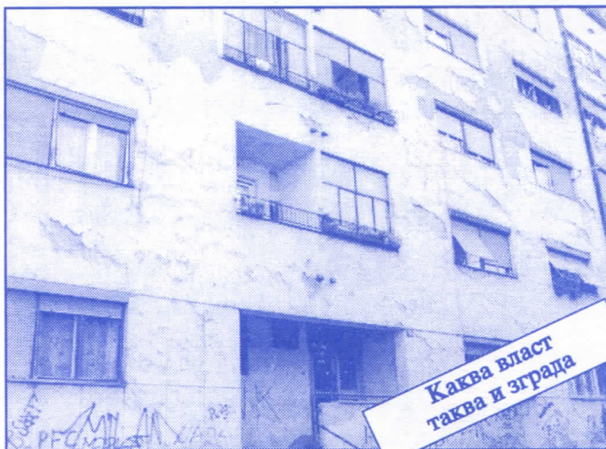
Каква власт таква и зграда

Заложите се за пројектовање и изградњу канализације за кишне и отпадне воде у сеоским насељима, очистићемо колекторе, умањимо опасност од бујица и активирања клизишта. У градском делу Палилуле решићемо проблем атмосферских вода које при изградњи новијих објеката нису каналисане те у време киша угрожавају сутерене и подруме околних зграда.