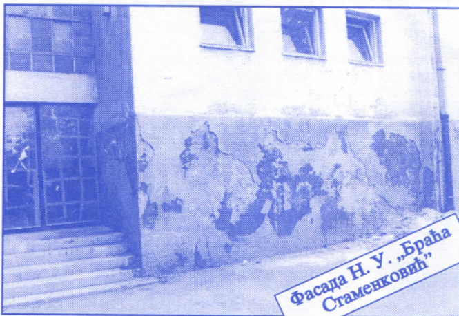
Фасада Н. У. „Браћа Стаменковић“

Грађевинско земљиште које је у општинској својини, понудићемо на лицитацију и под једнаким условима омогућићемо учешће физичким и правним лицима.