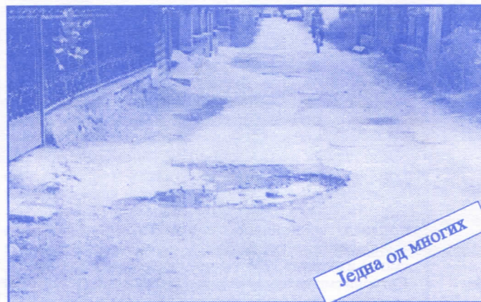
Једна од многих

Подржаваћемо донаторство и спонзорство као вид помагања културним установама. Покренућемо отварање нових огранака библиотека и обезбедити простор за њих (евентуално просторије месних заједница). Обновићемо домове културе у свим приградским насељима.