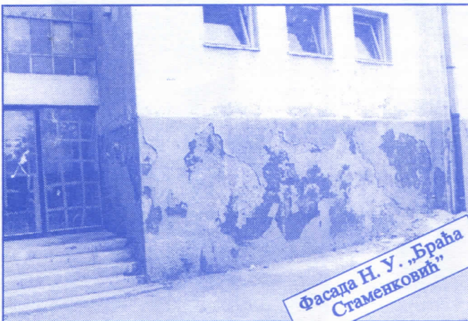
Фасада Н. У. „Браћа Стаменковић“

Грађевинско земљиште које је у општинској својини, понудићемо на лицитацију и под једнаким условима омогућићемо учешће физичким и правним лицима.