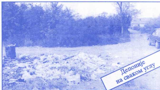
Депоније на сваком углу

• Оснивач и издавач: др Војислав Шешељ • Издање приредио: Општински одбор Српске радикалне странке Палилуле • Главни и одговорни уредник: Синиша Акентијевић • Заменик главног и одговорног уредника: Душан Весић • Помоћни главни и одговорног уредника: Јасна Олујић Радовановић • Техничко уређење и компјутерски прелом: Бранка Бобић и Саша Радовановић • Лектор: Зорица Илић • Редакција: Момир Марковић, Наташа Јовановић, Јадранка Шешељ, Јана Живаљевић, Александар Вучић, Драгољуб Стаменковић, Весна Арсић, Коста Димитријевић, Вељко Дукић, Весна Марић. • Секретар редакције: Љиљана Михајловић. • Штампана: „Стебра“ Војни пут блок 2/250ц, Земун