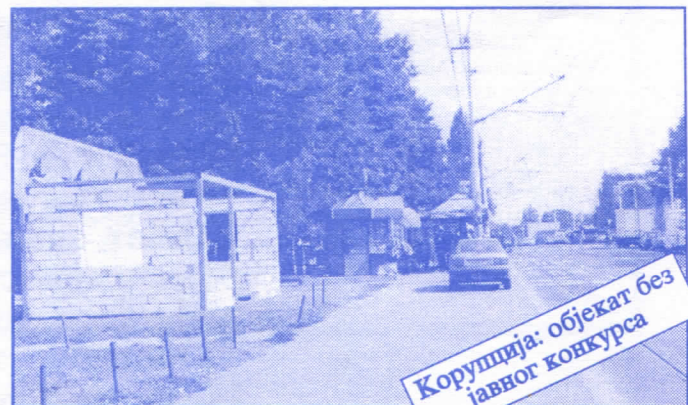
Корупција: објекат без јавног конкурса

Општина ће помоћи социјално најугроженије становнике Палилуле. Та помоћ ће имати једнократни карактер. Примат у оваквим акцијама имаће деца без родитеља, деца палих бораца, инвалиди последњег рата, стари грађани и физички хендикепирана лица. Организовање овакве помоћи биће обављено путем конкурса објављеног у општинским новинама (или другим средствима јавног информисања) на који ће моћи да се пријаве сви грађани општине Палилуле.