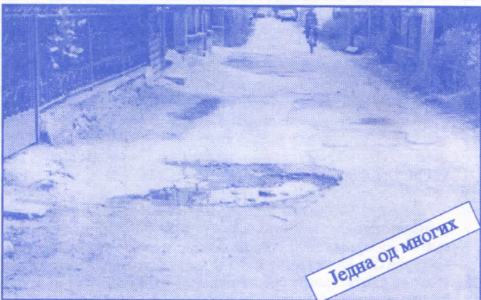
Једна од многих

Подржаваћемо донаторство и спонзорство као вид помагања културним установама. Покренућемо отварање нових огранака библиотеке и обезбедити простор за њих (евентуално просторије месних заједница). Обновићемо домове културе у свим приградским насељима.