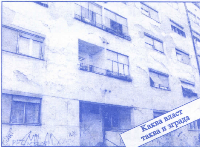
Каква власт таква и зграда

Заложимо се за пројектовање и изградњу канализације за кишне и отпадне воде у сеоским насељима, очистићемо колекторе, умањимо опасност од бујица и активирања клизишта. У градском делу Палилуле решићемо проблем атмосферских вода које при изградњи новијих објеката нису каналисане те у време киша угрожавају сутерене и подруме околних зграда.