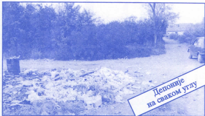
Депоније на сваком углу

• Оснивач и издавач: др Војислав Шешељ • Издање приредио: Општински одбор Српске радикалне странке Палилуле • Главни и одговорни уредник: Синиша Аксентијевић • Заменик главног и одговорног уредника: Душан Весић • Помоћник главног и одговорног уредника: Јасна Олујић Радовановић • Техничко уређење и компјутерски прелом: Бранка Божић и Саша Радовановић • Лектор: Зорица Илић • Редакција: Момир Марковић, Наташа Јовановић, Јадранка Шешељ, Жана Живаљевић, Александар Вучић, Драгољуб Стаменковић, Весна Арсић, Коста Димитријевић, Вељко Дукић, Весна Марић. • Секретар редакције: Љиљана Михајловић. • Штампана: „Стебра“ Војни пут блок 2/250ц, Земун