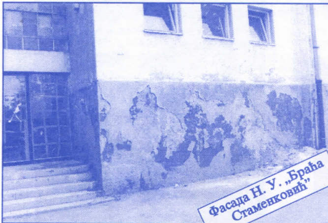
Фасада Н. У. „Браћа Стаменковић“

Грађевинско земљиште које је у општинској својини, понудићемо на лицитацију и под једнаким условима омогућићемо учешће физичким и правним лицима.