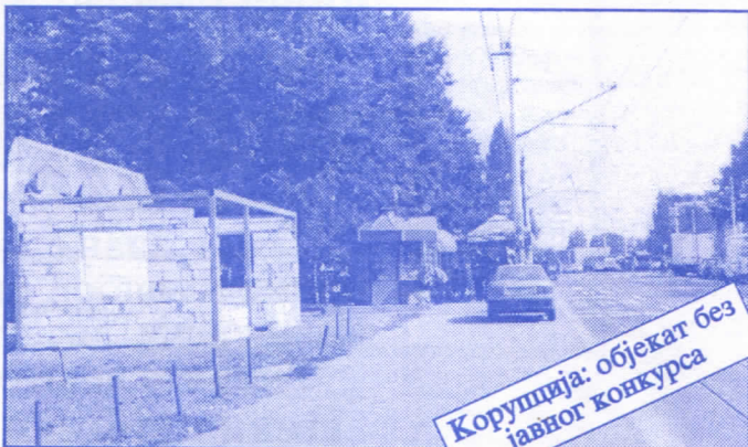
Корупција: објекат без јавног конкурса

Општина ће помоћи социјално најугроженије становнике Палилуле. Та помоћ ће имати једнократни карактер. Примат у оваквим акцијама имаће деца без родитеља, деца палих бораца, инвалиди последњег рата, стари грађани и физички хендикепирани лица. Организовање овакве помоћи биће обављено путем конкурса објављеног у општинским новинама (или другим средствима јавног информисања) на који ће моћи да се пријаве сви грађани општине Палилуле.