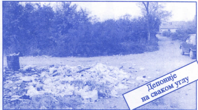
Депоније на сваком углу

• Оснивач и издавач: др Војислав Шешел • Издање приредио: Општински одбор Српске радикалне странке Палилуле • Главни и одговорни уредник: Синиша Аксентијевић • Заменик главног и одговорног уредника: Душан Весић • Помоћник главног и одговорног уредника: Јасна Олујић Радовановић • Техничко уређење и компјутерски прелом: Бранка Бобић и Саша Радовановић • Лектор: Зорица Илић • Редакција: Момир Марковић, Наташа Јовановић, Јадранка Шешел, Јана Живаљевић, Александар Вучић, Драгољуб Стаменковић, Весна Арсић, Коста Димитријевић, Вељко Дукић, Весна Марић. • Секретар редакције: Љиљана Михајловић. • Штампа: „Стебра“ Војни пут блок 2/250ц, Земун