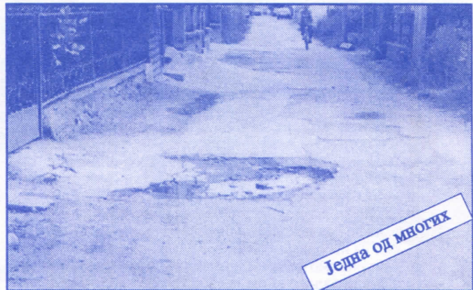
Једна од многих

Подржаваћемо донаторство и спонзорство као вид помагања културним установама. Покренућемо отварање нових огранака библиотеке и обезбедити простор за њих (евентуално просторије месних заједница). Обновићемо домове културе у свим приградским насељима.