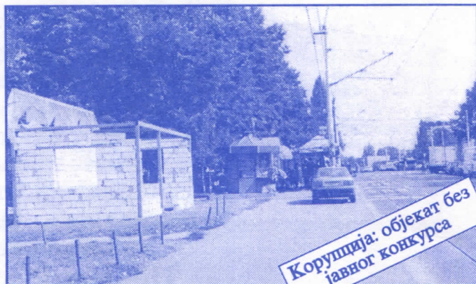
Корупција: објекат без јавног конкурса

Општина ће помоћи социјално најугроженије становнике Палилуле. Та помоћ ће имати једнократни карактер. Примат у оваквим акцијама имаће деца без родитеља, деца палих бораца, инвалиди последњег рата, стари грађани и физички хендикепирана лица. Организовање овакве помоћи биће обављено путем конкурса објављеног у општинским новинама (или другим средствима јавног информисања) на који ће моћи да се пријаве сви грађани општине Палилуле.