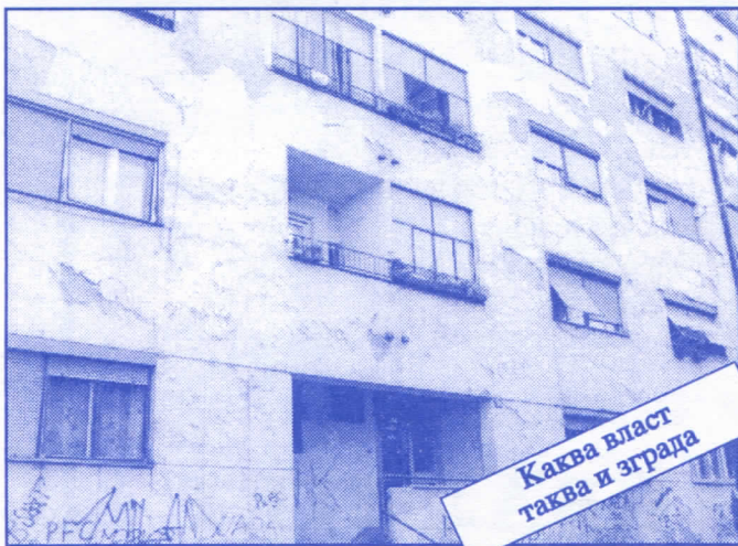
Каква власт таква и зграда

Заложите се за пројектовање и изградњу канализације за кишне и отпадне воде у сеоским насељима, очистићемо колекторе, умањимо опасност од бујица и активирања клизишта. У градском делу Палилуле решићемо проблем атмосферских вода које при изградњи новијих објеката нису канализане те у време киша угрожавају сутерене и подруме околних зграда.