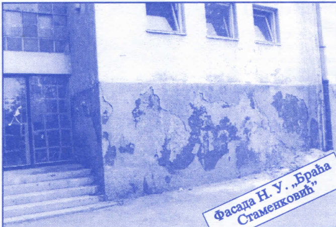
Фасада Н. У. „Браћа Стаменковић“

Преуговарање коришћења пословног простора са свим корисницима и јавно оглашавање издавања неискоришћеног пословног простора. Сви постојећи уговори штетни по Јавно предузеће, типа пазакупа и франшизе, биће одмах раскинути. Преговараћемо са значајним домаћим и страним фирмама око отварања њихових представништва на територији општине Палилула под најповољнијим условима. Смањићемо број корисника који користе простор без накнаде.