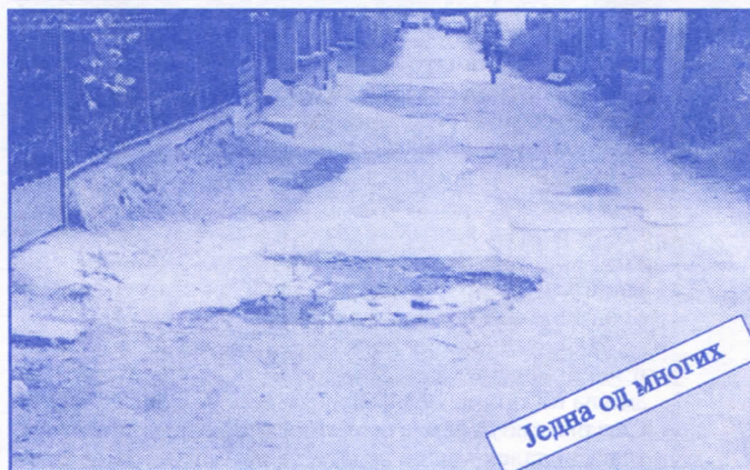
Једна од многих

Подржаваћемо донаторство и спонзорство као вид помагања културним установама. Покренућемо отварање нових огранака библиотеке и обезбедићемо простор за њих (евентуално просторије месних заједница). Обновићемо домове културе у свим приградским насељима.