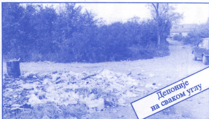
Депоније на сваком углу

• Оснивач и издавач: др Војислав Шешељ • Издање приредио: Општински одбор Српске радикалне странке Палилуле • Главни и одговорни уредник: Синиша Аксентијевић • Заменик главног и одговорног уредника: Душан Весић • Помоћник главног и одговорног уредника: Јасна Олујић Радовановић • Техничко уређење и компјутерски прелом: Бранка Бобић и Саша Радовановић • Лектор: Зорица Илић • Редакција: Момир Марковић, Наташа Јовановић, Јадранка Шешељ, Јана Живаљевић, Александар Вучић, Драгољуб Стаменковић, Весна Арсић, Коста Димитријевић, Вељко Дукић, Весна Марић. • Секретар редакције: Љилана Михајловић. • Штампа: „Стебра“ Војни пут блок 2/250ц, Земун