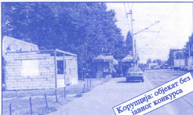
Корупција: објекат без јавног конкурса

Општина ће помоћи социјално најугроженије становнике Палилуле. Та помоћ ће имати једнократни карактер. Примат у оваквим акцијама имаће деца без родитеља, деца палих бораца, инвалиди последњег рата, стари грађани и физички хендикепирана лица. Организовање овакве помоћи биће обавњено путем конкурса објављеног у општинским новинама (или другим средствима јавног информисања) на који ће моћи да се пријаве сви грађани општине Палилуле.