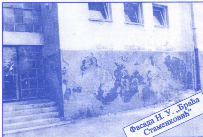
Фасада Н. У. „Браћа Стаменковић“

Грађевинско земљиште које је у општинској својини, понудићемо на лицитацију и под једнаким условима омогућићемо учешће физичким и правним лицима.