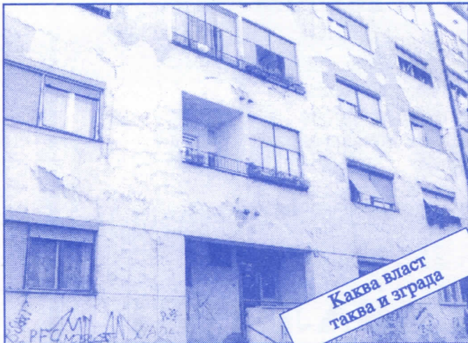
Каква власт таква и зграда

Заложићемо се за пројектовање и изградњу канализације за кишне и отпадне воде у сеоским насељима, очистићемо колекторе, умањићемо опасност од бујица и активирања клизишта. У градском делу Палилуле решићемо проблем атмосферских вода које при изградњи новијих објеката нису каналисане те у време киша угрожавају сутерене и подруме околних зграда.