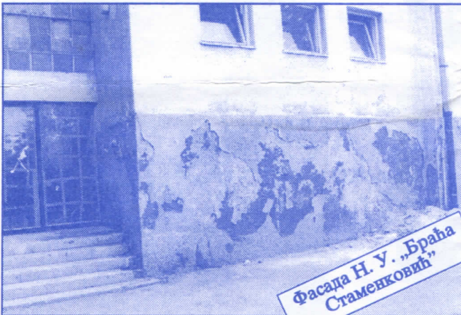
Фасада Н. У. „Браћа Стаменковић“

Преуговарање коришћења пословног простора са свим корисницима и јавно оглашавање издавања неискоришћеног пословног простора. Сви постојећи уговори штетни по Јавно предузеће, типа пазакупа и франшизе, биће одмах раскинути. Преговараћемо са значајним домаћим и страним фирмама око отварања њихових представништва на територији општине Палилула под најповољнијим условима. Смањићемо број корисника који користе простор без накнаде.