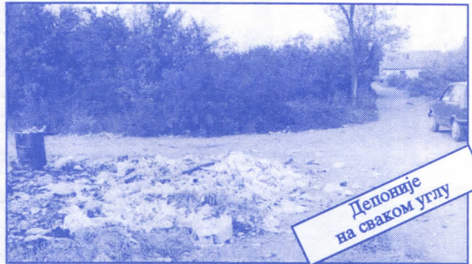
Депоније на сваком углу

• Оснивач и издавач: др Војислав Шешел • Издање приредио: Општински одбор Српске радикалне странке Палилуле • Главни и одговорни уредник: Синиша Асентијевић • Заменик главног и одговорног уредника: Душан Весић • Помоћник главног и одговорног уредника: Јасна Олујић Радовановић • Техничко уређење и компјутерски шредом: Бранка Бобић и Саша Радовановић • Лектор: Зорица Илић • Редакција: Момир Марковић, Наташа Јовановић, Јадранка Шешел, Жана Живаљевић, Александар Вучић, Драгољуб Стаменковић, Весна Арсић, Коста Димитријевић, Вељко Дукић, Весна Марић. • Секретар редакције: Љиљана Михајловић. • Штампа: „Стебра“ Војни пут блок 2/250ц, Земун