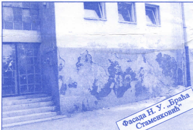
Фасада Н. У. „Браћа Стамечковић“

Грађевинско земљиште које је у општинској својини, понудићемо на лицитацију и под једнаким условима омогућићемо учешће физичким и правним лицима.