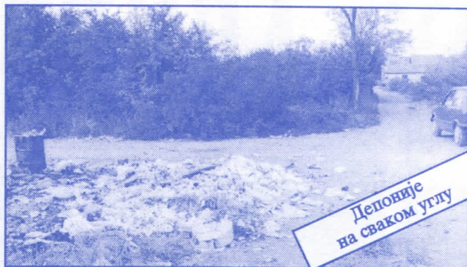
Депоније на сваком углу

• Оснивач и издавач: др Војислав Шешељ • Издање приредио: Општински одбор Српске радикалне странке Палилуле • Главни и одговорни уредник: Синиша Акентијевић • Заменик главног и одговорног уредника: Душан Весић • Помоћник главног и одговорног уредника: Јасна Олујић Радовановић • Техничко уређење и компјутерски прелом: Бранка Бобић и Саша Радовановић • Лектор: Зорица Илић • Редакција: Момир Марковић, Наташа Јовановић, Јадранка Шешељ, Јана Живљевић, Александар Вучић, Драгољуб Стаменковић, Весна Арсић, Коста Димитријевић, Вељко Дукић, Весна Марић. • Секретар редакције: Љиљана Михајловић. • Штампа: „Стебра“ Војни пут блок 2/250ц, Земун