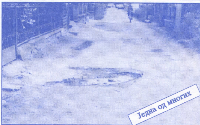
Једна од многих

Подржаваћемо донаторство и спонзорство као вид помагања културним установама. Покренућемо отварање нових огранака библиотеке и обезбедити простор за њих (евентуално просторије месних заједница). Обновићемо домове културе у свим приградским насељима.