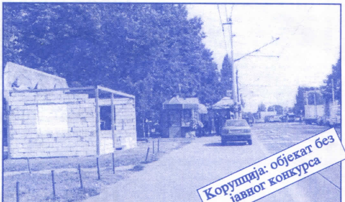
Корупција: објекат без јавног конкурса

Општина ће помоћи социјално најугроженије становнике Палилуле. Та помоћ ће имати једнократни карактер. Примат у оваквим акцијама имаће деца без родитеља, деца палих бораца, инвалиди последњег рата, стари грађани и физички хендикепирана лица. Организовање овакве помоћи биће обављено путем конкурса објављеног у општинским новинама (или другим средствима јавног информисања) на који ће моћи да се пријаве сви грађани општине Палилуле.