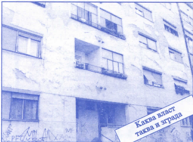
Каква власт таква и зграда

Заложите се за пројектовање и изградњу канализације за кишне и отпадне воде у сеоским насељима, очистићемо колекторе, умањимо опасност од бујица и активирања клизишта. У градском делу Палилуле решићемо проблем атмосферских вода које при изградњи новијих објеката нису каналисане те у време киша угрожавају сутерене и подруме околних зграда.