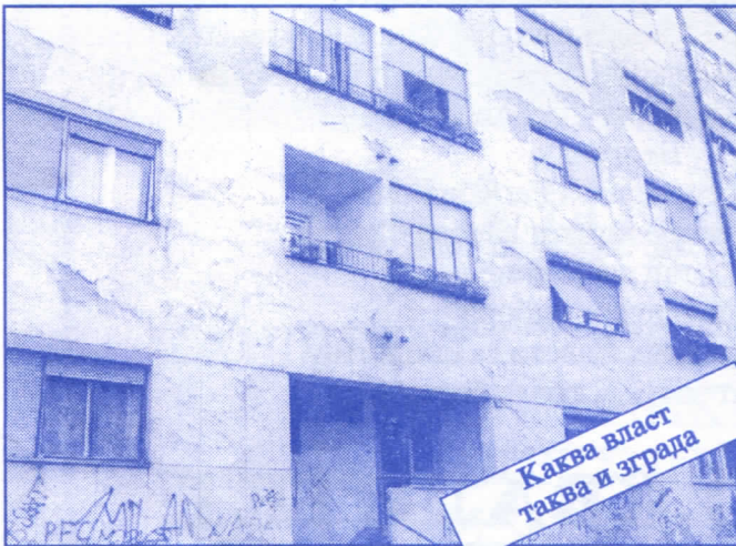
Каква власт таква и зграда

Заложите се за пројектовање и изградњу канализације за кишне и отпадне воде у сеоским насељима, очистићемо колекторе, умањимо опасност од бујица и активирања клизишта. У градском делу Палилуле решићемо проблем атмосферских вода које при изградњи новијих објеката нису канализисане те у време киша угрожавају сутерене и подруме околних зграда.