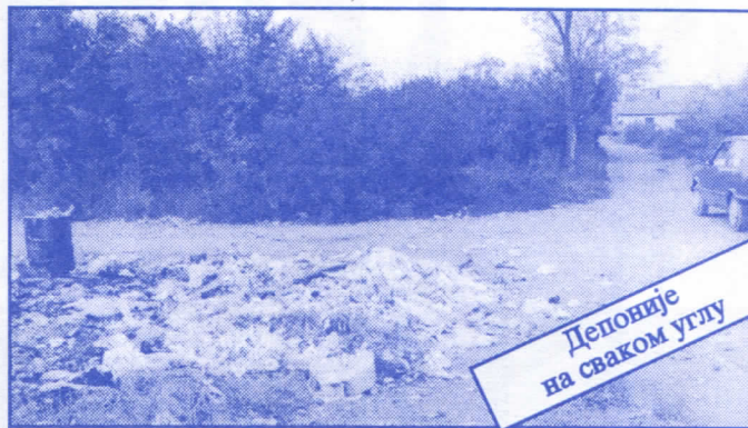
Депоније на сваком углу

• Оснивач и издавач: др Војислав Шешељ • Издање приредио: Општински одбор Српске радикалне странке Палилуле • Главни и одговорни уредник: Синиша Аксентијевић • Заменик главног и одговорног уредника: Душан Весић • Помоћник главног и одговорног уредника: Јасна Олујић Радовановић • Техничко уређење и компјутерски прелом: Бранка Бобић и Саша Радовановић • Лектор: Зорица Илић • Редакција: Момир Марковић, Наташа Јовановић, Јадранка Шешељ, Јана Живаљевић, Александар Вучић, Драгољуб Стаменковић, Весна Арсић, Коста Димитријевић, Вељко Дукић, Весна Марић. • Секретар редакције: Љиљана Михајловић. • Штампа: „Стебра” Војни пут блок 2/250ц, Земун