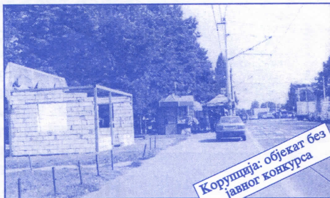
Корупција: објекат без јавног конкурса

Грађевинско земљиште које је у општинској својини, понудићемо на лицитацију и под једнаким условима омогућићемо учешће физичким и правним лицима.