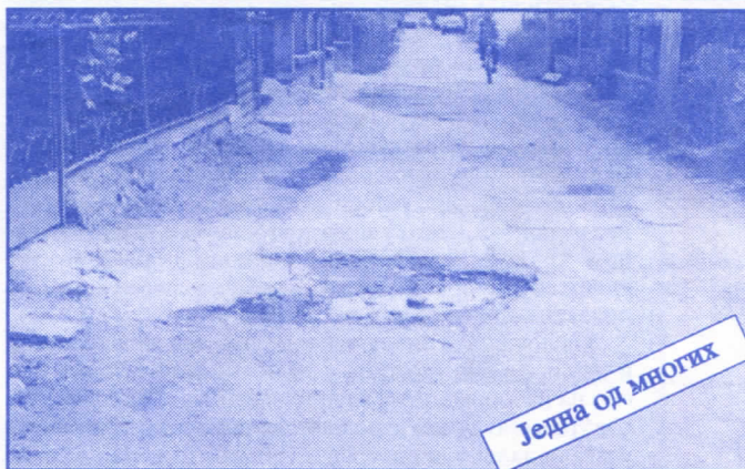
Једна од многих

Подржаваћемо донаторство и спонзорство као вид помагања културним установама. Покренућемо отварање нових огранака библиотека и обезбедити простор за њих (евентуално просторије месних заједница). Обновићемо домове културе у свим приградским насељима.