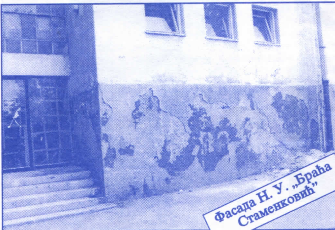
Фасада Н. У. „Браћа Стамејковић“

Организоваћемо да се послови општинске управе врше преко: Одељења за општу управу, Одељења за грађевинске и комуналне послове, Одељења за финансије, привреду, друштвене делатности и планирање, Одељења за имовинско-правне и стамбене послове, Службе за скупштинске и заједничке послове и Службе за информисање.