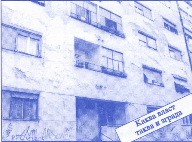
Каква власт таква и зграда