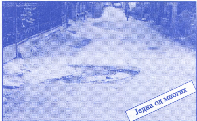
Једна од многих

Подржаваћемо донаторство и спонзорство као вид помагања културним установама. Покренућемо отварање нових огранака библиотеке и обезбедити простор за њих (евентуално просторије месних заједница). Обновићемо домове културе у свим приградским насељима.