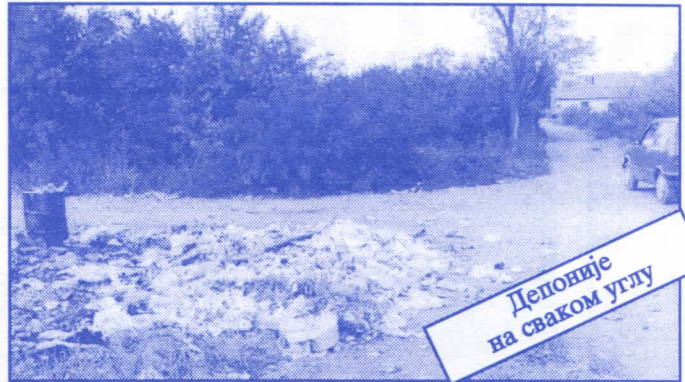
Депоније на сваком углу

Општинском одбору Српске радикалне странке Палилула; Улица Прерадовићева 4, 11000 Београд; телефон: 764-546 и 766-889.