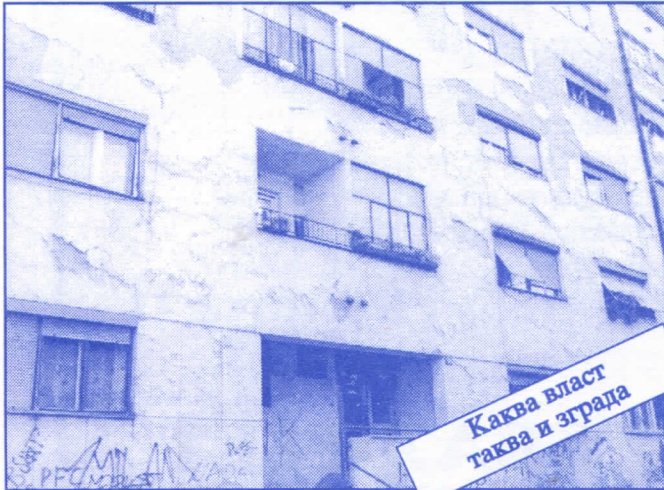
Каква власт таква и зграда

Заложићемо се за пројектовање и изградњу канализације за кишне и отпадне воде у сеоским насељима, очистићемо колекторе, умањићемо опасност од бујица и активирања клизишта. У градском делу Палилуле решићемо проблем атмосферских вода које при изградњи новијих објеката нису каналисане те у време киша угрожавају сутерене и подруме околних зграда.