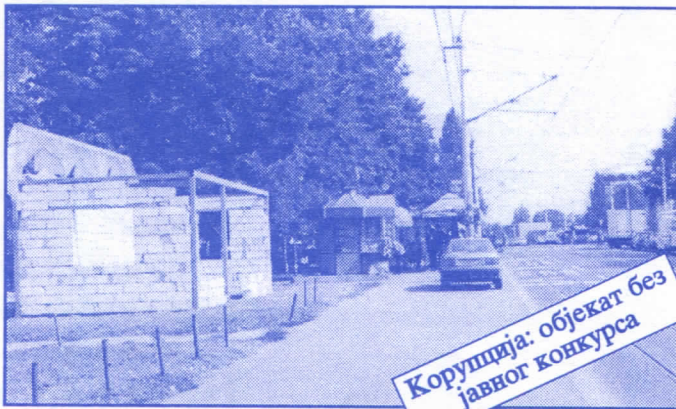
Корупција: објекат без јавног конкурса

Општина ће помоћи социјално најугроженије становнике Палилуле. Та помоћ ће имати једнократни карактер. Примат у оваквим акцијама имаће деца без родитеља, деца палих бораца, инвалиди последњег рата, стари грађани и физички хендикепирана лица. Организовање овакве помоћи биће обављено путем конкурса објављеног у општинским новинама (или другим средствима јавног информисања) на који ће моћи да се пријаве сви грађани општине Палилуле.