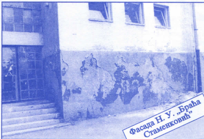
Фасада Н. У. „Браћа Стаменковић“

Грађевинско земљиште које је у општинској својини, понудићемо на лицитацију и под једнаким условима омогућићемо учешће физичким и правним лицима.