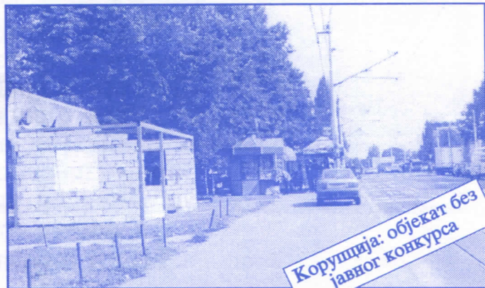
Корупција: објекат без јавног конкурса

Општина ће помоћи социјално најугроженије становнике Палилуле. Та помоћ ће имати једнократни карактер. Примат у оваквим акцијама имаће деца без родитеља, деца палих бораца, инвалиди последњег рата, стари грађани и физички хендикепирана лица. Организовање овакве помоћи биће обавњено путем конкурса објављеног у општинским новинама (или другим средствима јавног информисања) на који ће моћи да се пријаве сви грађани општине Палилуле.