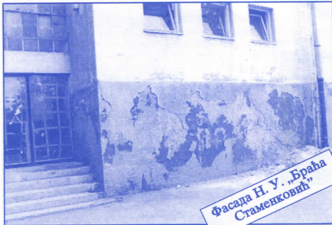
Фасада Н. У. „Браћа Стаменковић“

Грађевинско земљиште које је у општинској својини, понудићемо на лицитацију и под једнаким условима омогућићемо учешће физичким и правним лицима.