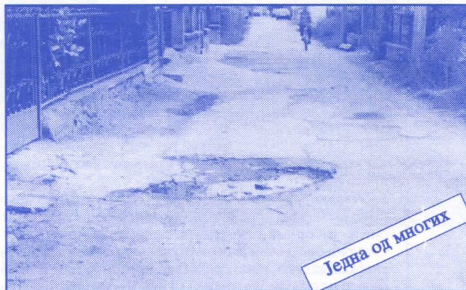
Једна од многих

Подржаваћемо донаторство и спонзорство као вид помагања културним установама. Покренућемо отварање нових огранака библиотеке и обезбедити простор за њих (евентуално просторије месних заједница). Обновићемо домове културе у свим приградским насељима.