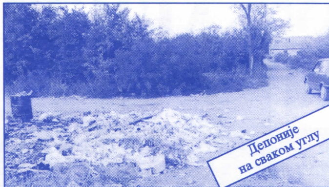
Депоније на сваком углу

Заложите се за пројектовање и изградњу канализације за кишне и отпадне воде у сеоским насељима, очистићемо колекторе, умањимо опасност од бујица и активирања клизишта. У градском делу Палилуле решићемо проблем атмосферских вода које при изградњи новијих објеката нису канализане те у време киша угрожавају сутерене и подруме околних зграда.