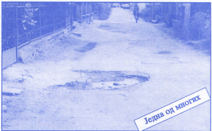
Једна од многих

Подржаваћемо донаторство и спонзорство као вид помагања културним установама. Покренућемо отварање нових огранака библиотеке и обезбедити простор за њих (евентуално просторије месних заједница). Обновићемо домове културе у свим приградским насељима.