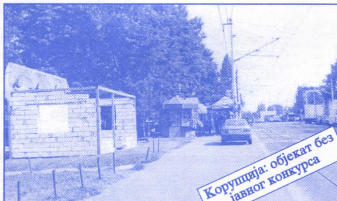
Корупција: објекат без јавног конкурса

Општина ће помоћи социјално најугроженије становнике Палилуле. Та помоћ ће имати једнократни карактер. Примат у оваквим акцијама имаће деца без родитеља, деца палих бораца, инвалиди последњег рата, стари грађани и физички хендикепирана лица. Организовање овакве помоћи биће обављено путем конкурса објављеног у општинским новинама (или другим средствима јавног информисања) на који ће моћи да се пријаве сви грађани општине Палилуле.