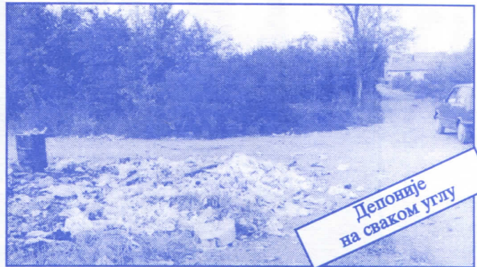
Депоније на сваком углу

• Оснивач и издавач: др Војислав Шешељ • Издање приредио: Општински одбор Српске радикалне странке Палилуле • Главни и одговорни уредник: Синиша Аксентијевић • Заменик главног и одговорног уредника: Душан Весић • Помоћник главног и одговорног уредника: Јасна Олић Радовановић • Техничко уређење и компјутерски прелом: Бранка Божић и Саша Радовановић • Лектор: Зорица Илић • Редакција: Момир Марковић, Наташа Јовановић, Јадранка Шешељ, Јана Живљевић, Александар Вучић, Драгољуб Стаменковић, Весна Арсић, Коста Димитријевић, Вељко Дукић, Весна Марић. • Секретар редакције: Љиљана Михајловић. • Штампа: „Стебра“ Војни пут блок 2/250ц, Земун