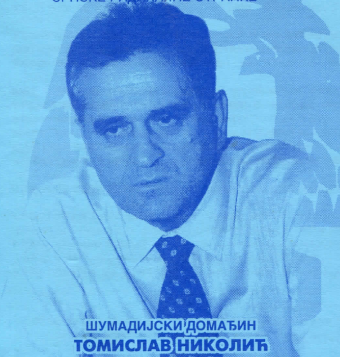
ШУМАДИЈСКИ ДОМАЋИН ТОМИСЛАВ НИКОЛИЋ

ПРЕДСЕДНИЧКИ КАНДИДАТ СРПСКЕ РАДИКАЛНЕ СТРАНКЕ