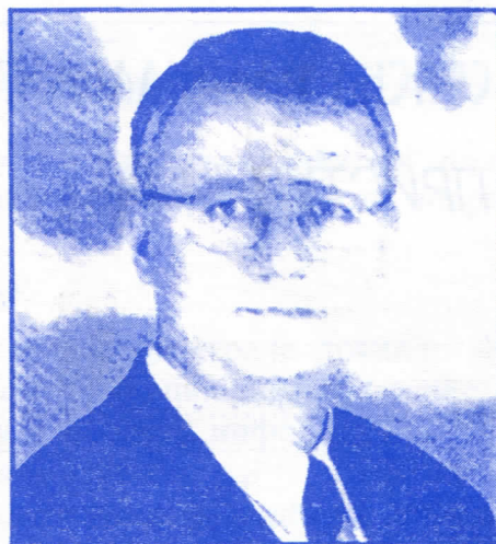
ВОЈИСЛАВ ШЕШЕЉ ПРЕДСЕДНИК СРПСКЕ РАДИКАЛНЕ СТРАНКЕ