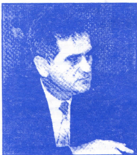
ТОМИСЛАВ НИКОЛИЋ ПРЕСЕДНИЧКИ КАНДИДАТ СРПСКЕ РАДИКАЛНЕ СТРАНКЕ