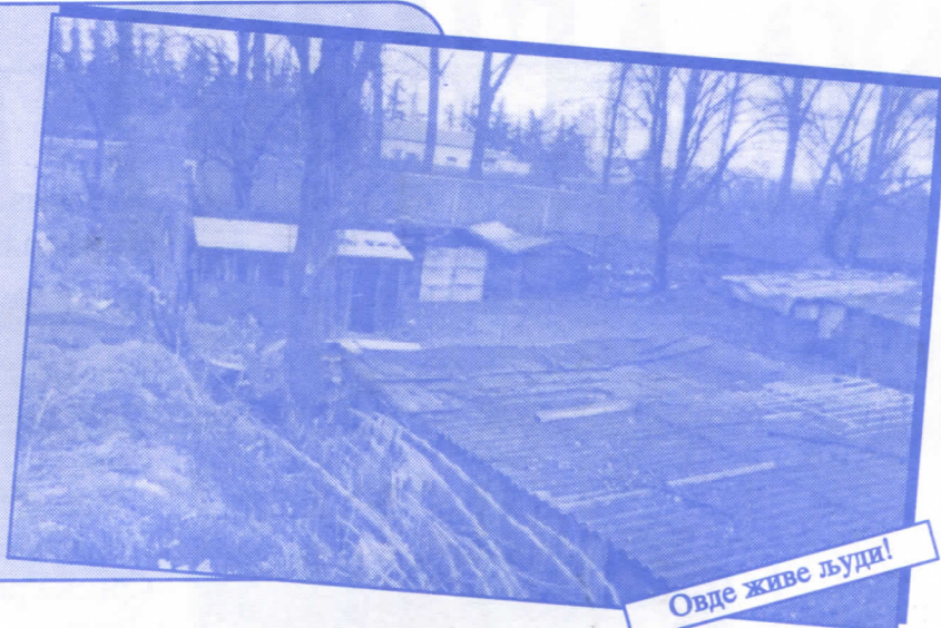
Овде живе људи!

Урадићемо окретницу за градски саобраћај Уредићемо пословни простор око Месне заједнице