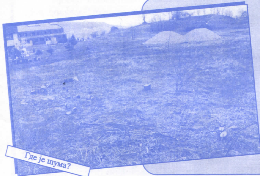
Где је шума?