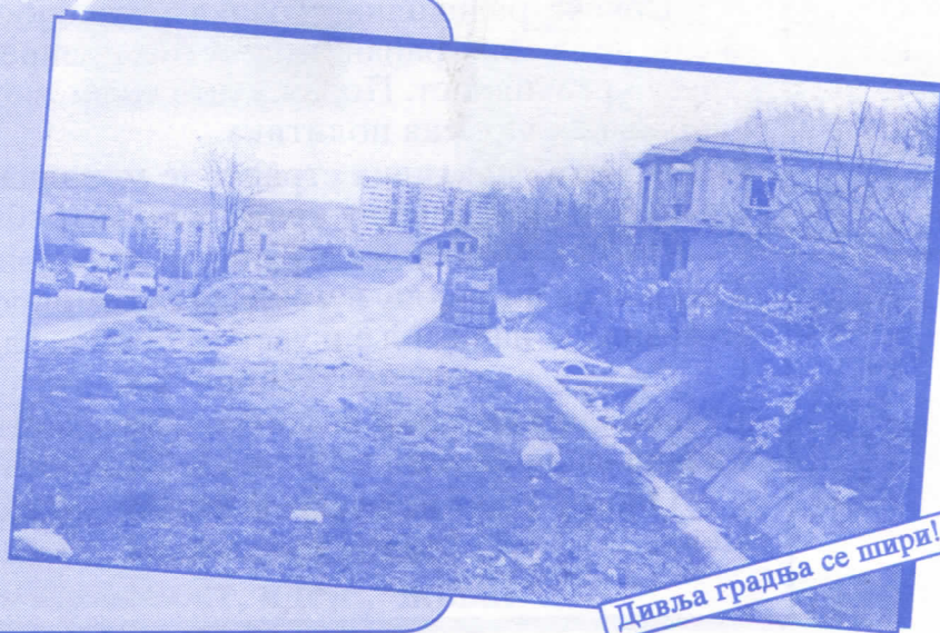
Дивља градња се шири!

Уредићемо водовод и канализацију Асфалтираћемо улице и поставићемо контејнере Завршићемо увођење нових телефонских прикључака