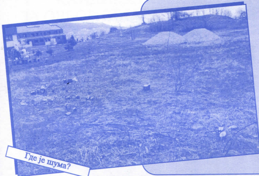
Где је шума?