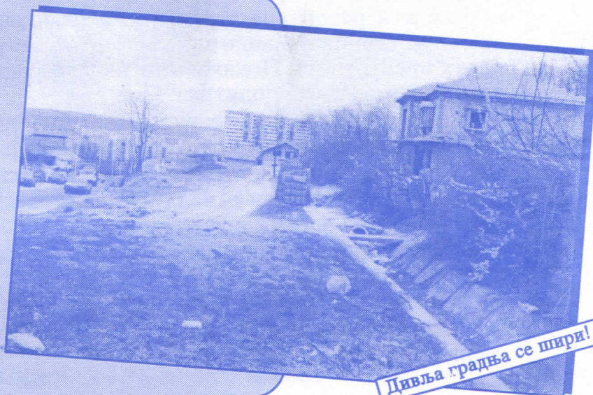
Дивља градња се шири!

Уредићемо водовод и канализацију Асфалтираћемо улице и поставићемо контејнере Завршићемо увођење нових телефонских прикључака