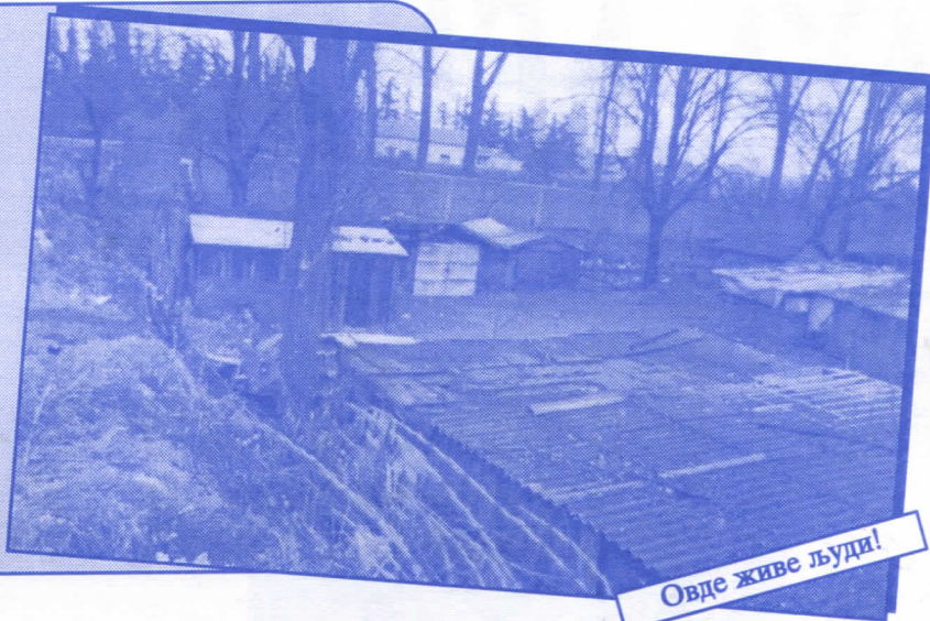
Овде живе људи!

Уредићемо пословни простор око Месне заједнице