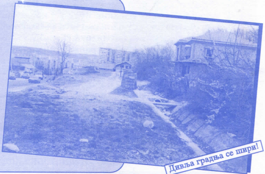
Дивља градња се шири!

Уредићемо водовод и канализацију Асфалтираћемо улице и поставићемо контејнере Завршићемо увођење нових телефонских прикључака