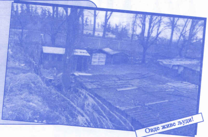
Овде живе људи!

Урадићемо окретницу за градски саобраћај Уредићемо пословни простор око Месне заједнице