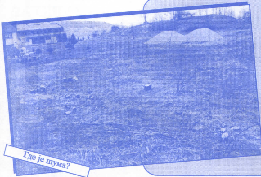
Где је шума?