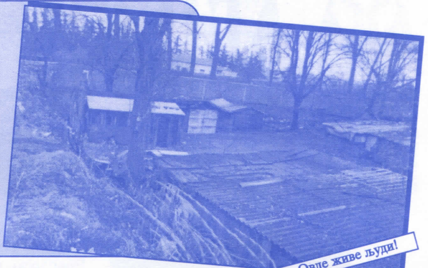
Овде живе људи!

Урадићемо окретницу за градски саобраћај Уредићемо пословни простор око Месне заједнице