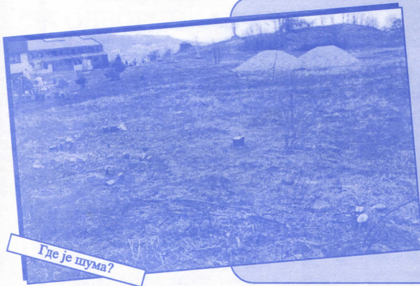
Где је шума?