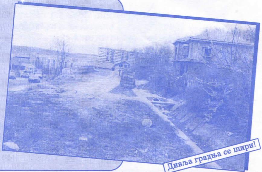
Дивља градња се шири!

Уредићемо водовод и канализацију Асфалтираћемо улице и поставићемо контејнере Завршићемо увођење нових телефонских прикључака