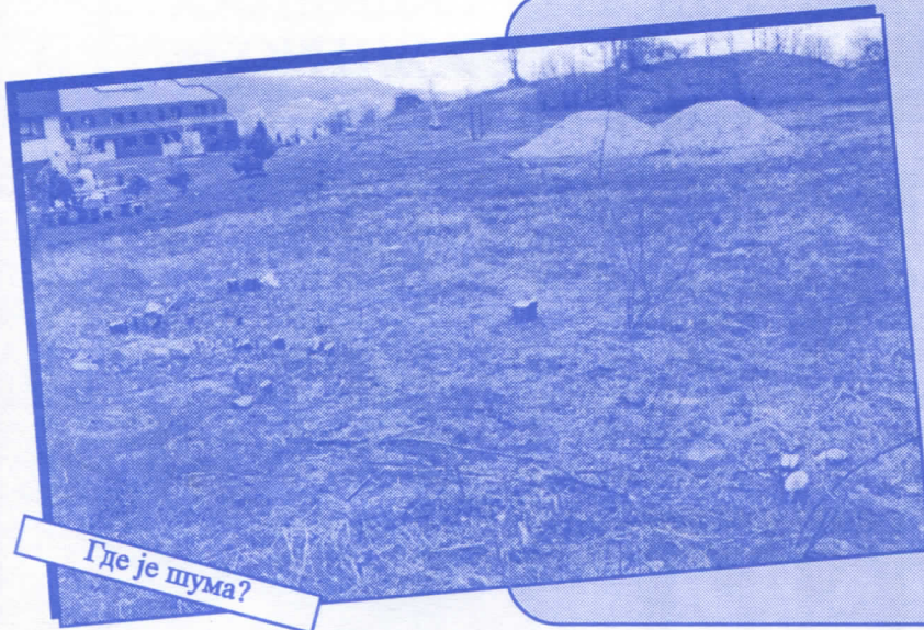
Где је шума?