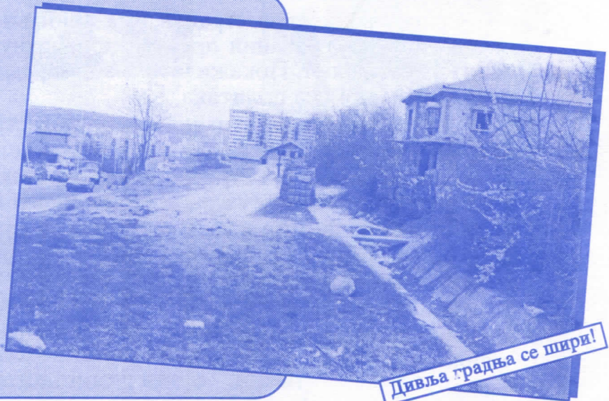
Дивља градња се шири!

Уредићемо водовод и канализацију Асфалтираћемо улице и поставићемо контејнере Завршићемо увођење нових телефонских прикључака