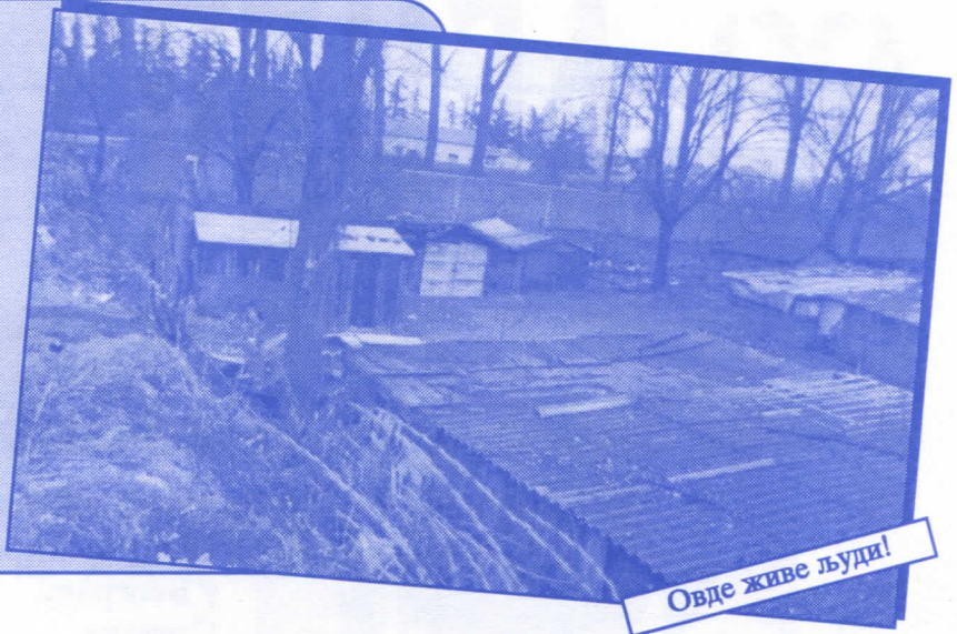
Овде живе људи!

Урадићемо окретницу за градски саобраћај Уредићемо пословни простор око Месне заједнице