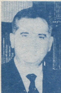
ТОМИСЛАВ НИКОЛИЋ КАНДИДАТ СРПСКЕ РАДИКАЛНЕ СТРАНКЕ ЗА ПРЕДСЕДНИКА ЈУГОСЛАВИЈЕ