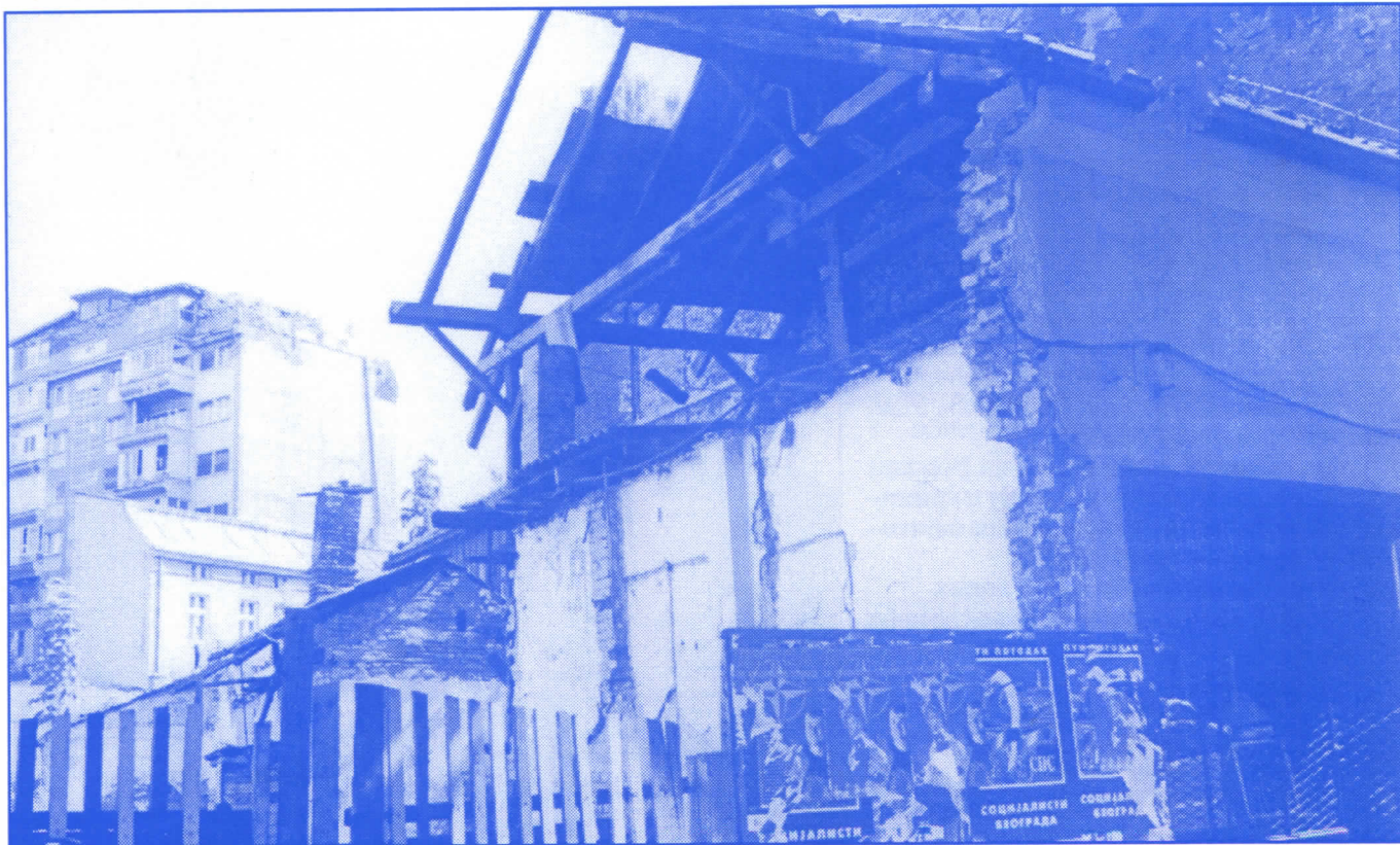
Досадашња власт на Врачару је показала да је најлакше рушити

Председник општине и сви одборници мораће да буду у сталном контакту са грађанима и да непрестано изналазе начине да им, колико је то у њиховој моћи, помогну, а не да после избора изгубе сваки контакт са њима и