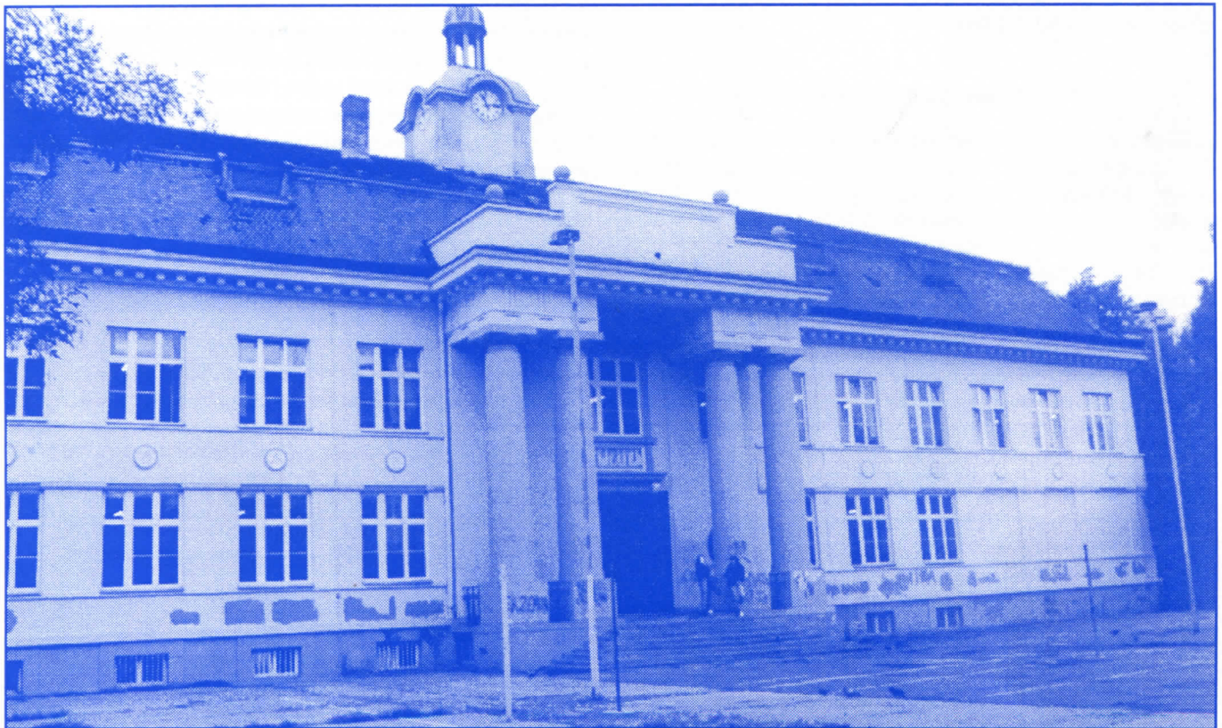
Радикалска власт у Земуну је доказала да способни граде

Без обзира на то што је санирање постојећих и изградња нових улица у надлежности Скупштине града, српски радикали на Врачару, поучени бројним примерима из општине Земун, сигурно ће наћи потребна финансијска средства да поправе све улице и тротоаре на територији општине. Чистији ваздух и већа безбедност грађана омогућиће се краћим задржавањем возила која кроз подручје општине пролазе за насеља Шумице, Браће Јер-