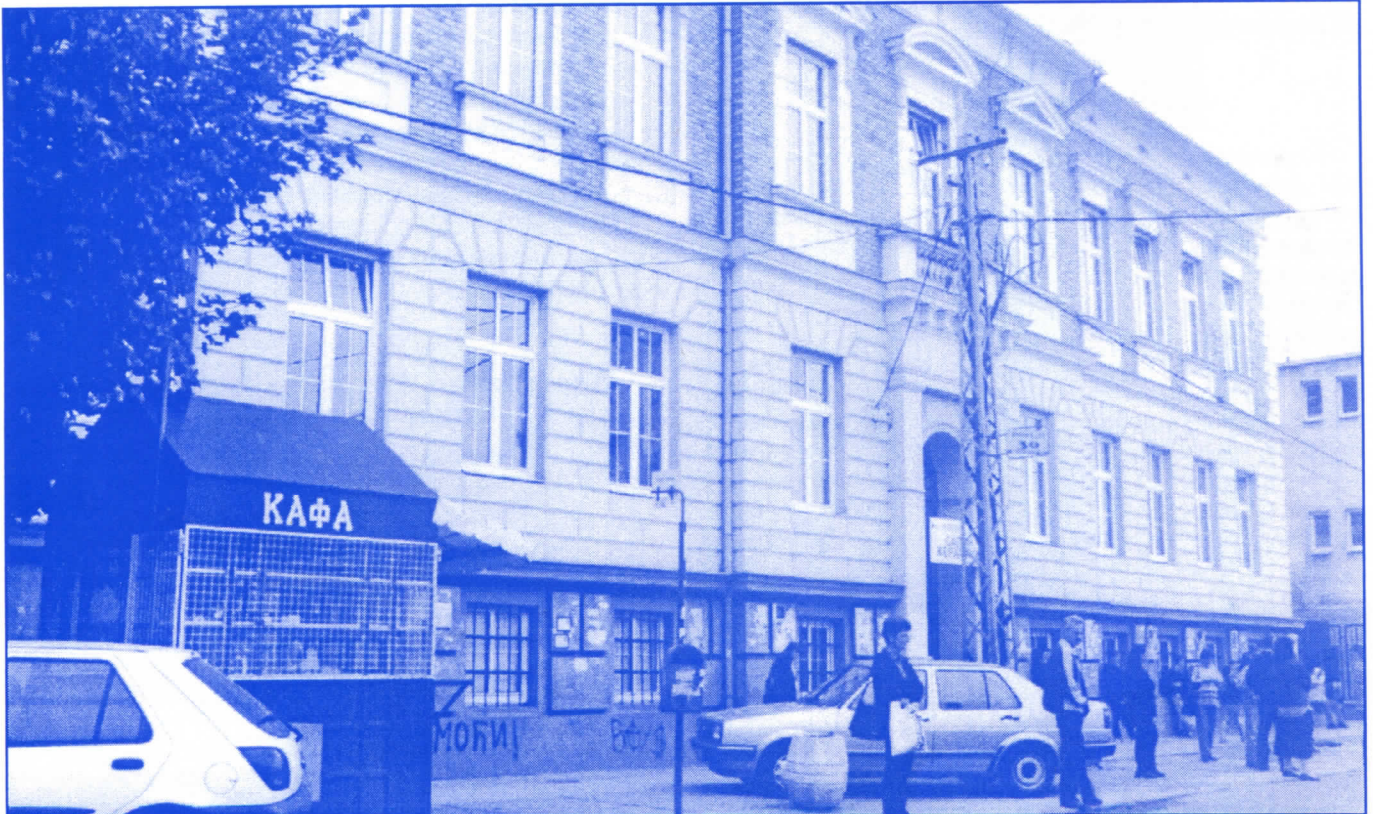
Радикалска власт у Земуну је доказала да способни граде

Без обзира на то што је санирање постојећих и изградња нових улица у надлежности Скупштине града, српски радикали на Врачару, поучени бројним примерима из општине Земун, сигурно ће наћи потребна финансијска средства да поправе све улице и тротоаре на територији општине. Чистији ваздух и већа безбедност грађана омогућиће се краћим задржавањем возила која кроз подручје општине пролазе за насеља Шумице, Браће Јер-