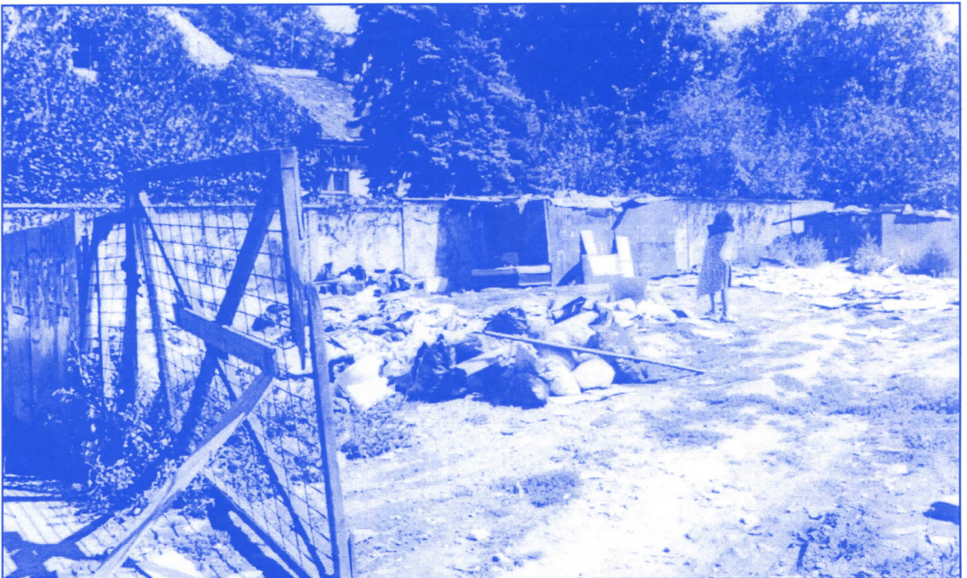
Досадашња власт на Врачару је показала да је најлакше рушити

Председник општине и сви одборници мораће да буду у сталном контакту са грађанима и да непрестано налазе начине да им, колико је то у њиховој моћи, помогну, а не да после избора изгубе сваки контакт са њима и