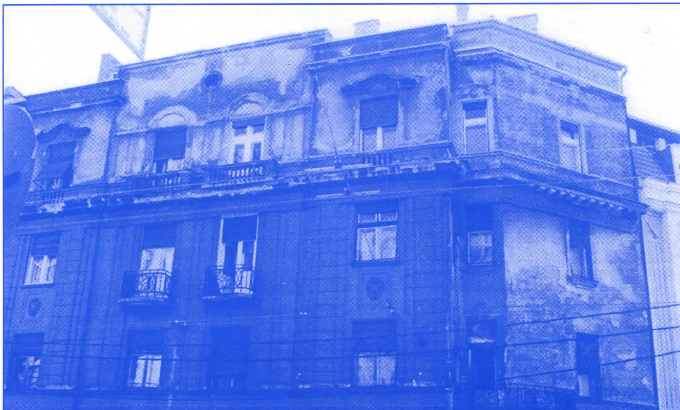
Досадашња власт на Врачару је показала да је најлакше рушити

Председник општине и сви одборници мораће да буду у сталном контакту са грађанима и да непрестано изналазе начине да им, колико је то у њиховој моћи, помогну, а не да после избора изгубе сваки контакт са њима и