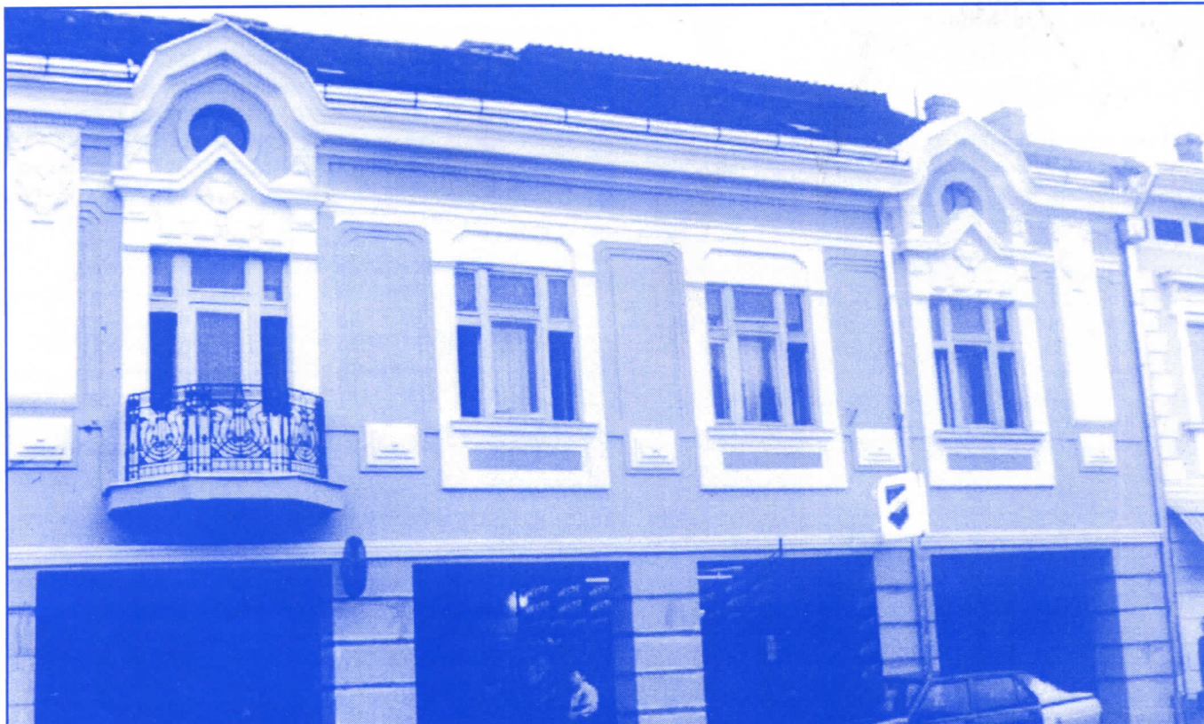
Радикалска власт у Земуну је доказала да способни граде

Без обзира на то што је санирање постојећих и изградња нових улица у надлежности Скупштине града, српски радикали на Врачару, поучени бројним примерима из општине Земун, сигурно ће наћи потребна финансијска средства да поправе све улице и тротоаре на територији општине. Чистији ваздух и већа безбедност грађана омогућиће се краћим задржавањем возила која кроз подручје општине пролазе за насеља Шумице, Браће Јер-