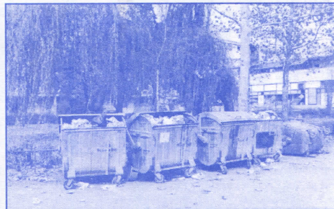
Уредићемо зелене површине и уклонићемо смеће из непосредне близине простора на којима се играју деца