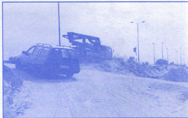
Реконструисаћемо и асфалтираћемо све улице и уредићемо прилазе Панчевачком путу