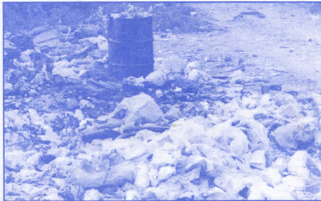
Легализоваћемо све бесправно подигнуте објекте, израдићемо елаборате кишне и фекалне канализације и уклонићемо све дивље депоније смећа