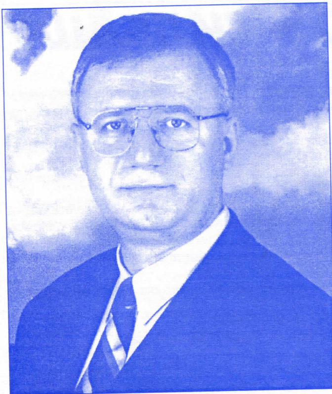
Председник Српске радикалне странке Др Војислав Шешел