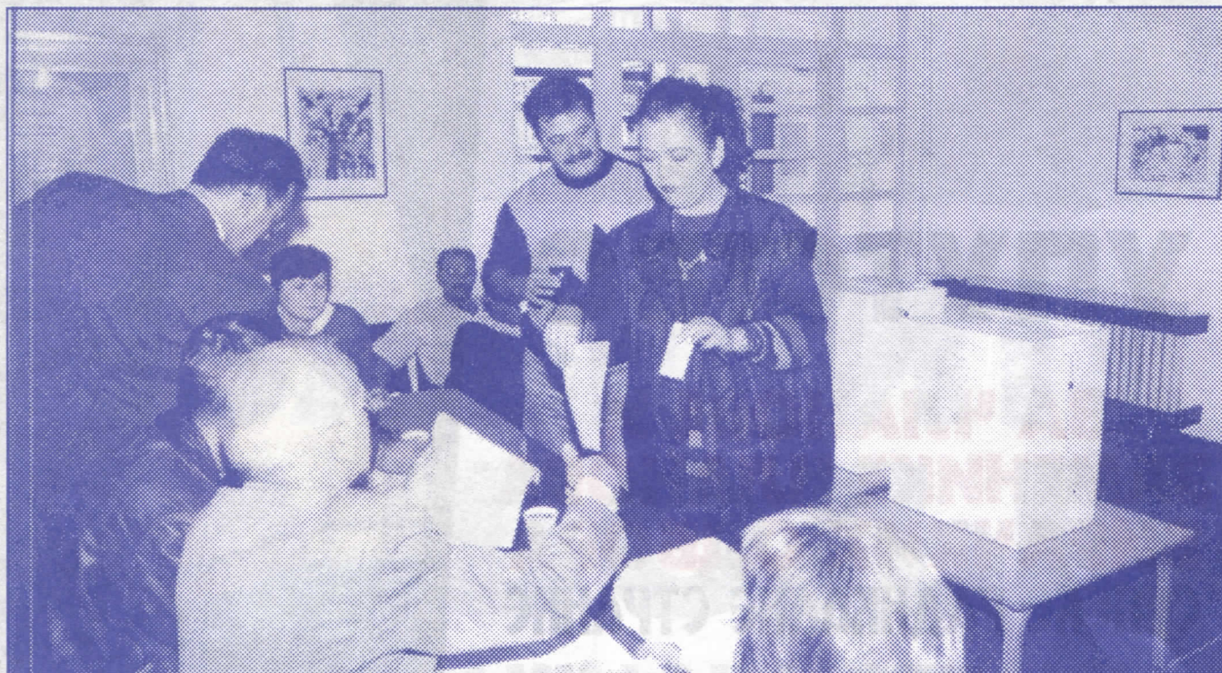
Бирачко место: ниједног момента без контроле

Бирачи који су ван места у коме су уписани у бирачке спискове, морају пре избора затражити од бирачког одбора документа за гласање путем писма. Узимају се у обзир само писма