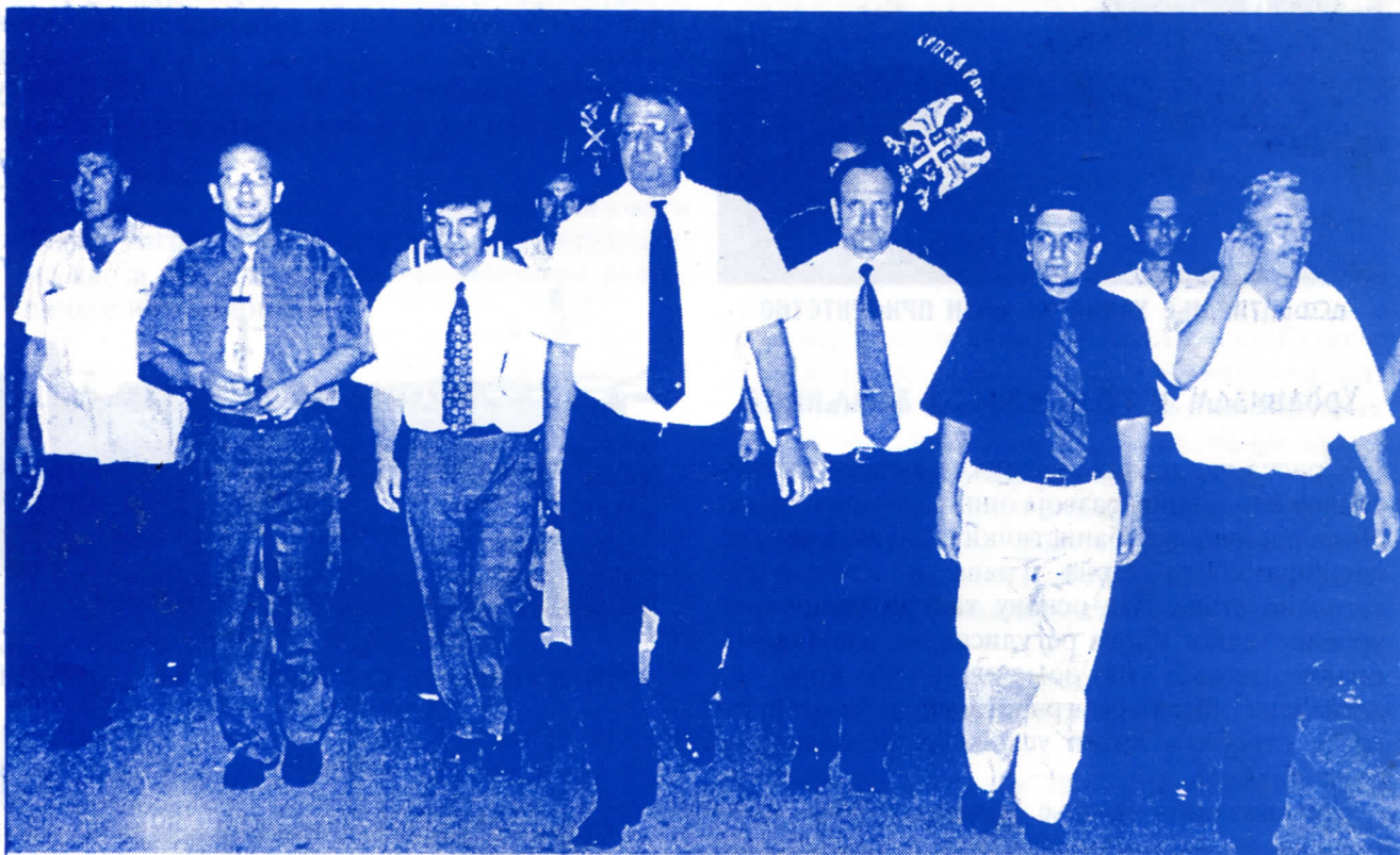
МИ ДОЛАЗИМО - СРПСКА РАДИКАЛНА СТРАНКА