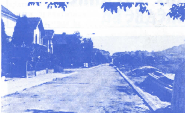
АСФАЛТИРАЊЕ УЛИЦА ЋЕ БИТИ ПРИОРИТЕТНО

Општина Медвеђа ће се финансирати од административних и комуналних такси, накнада од заузећа јавних површина, постављања киоска и мањих монтажних објеката као и дела прихода јавних предузећа, чији је оснивач општина Медвеђа.