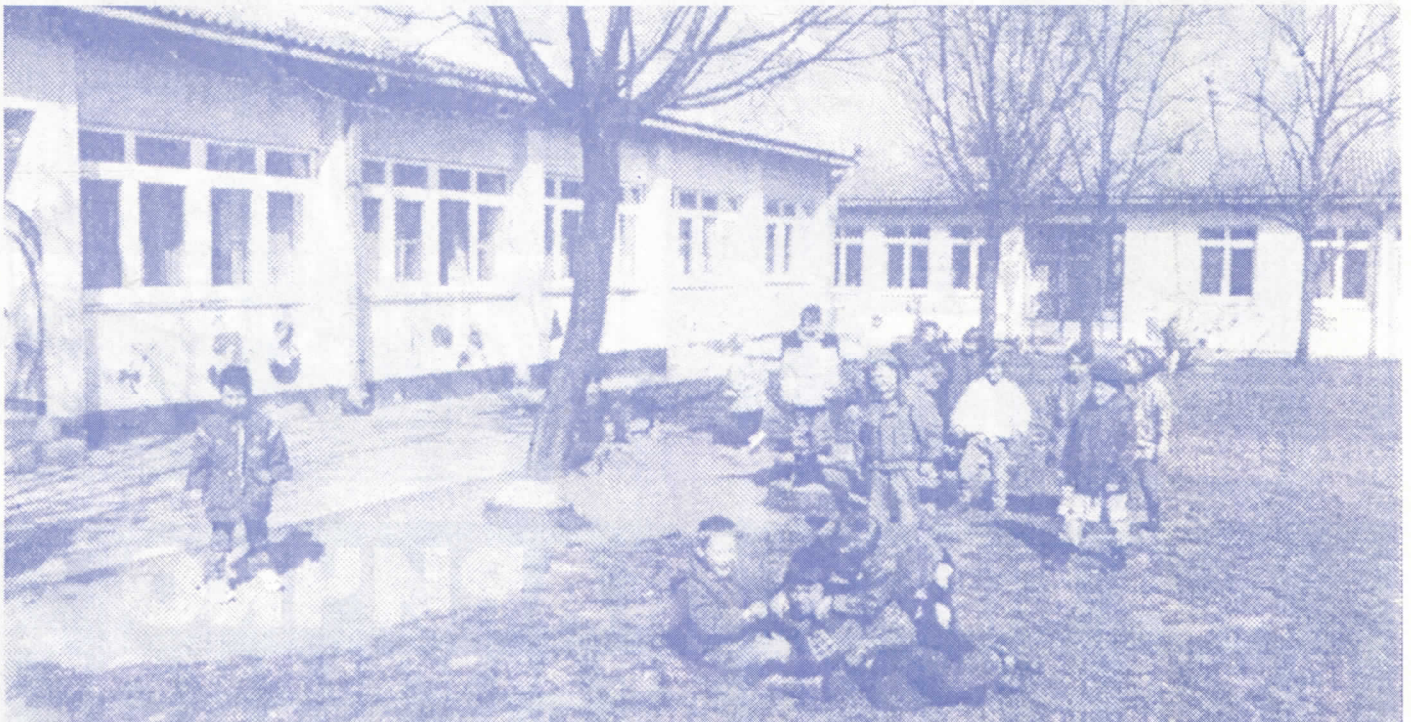
На млађима свиј оснијаје: Оснивамо деци у наслеђе јраве вредности а не хаос