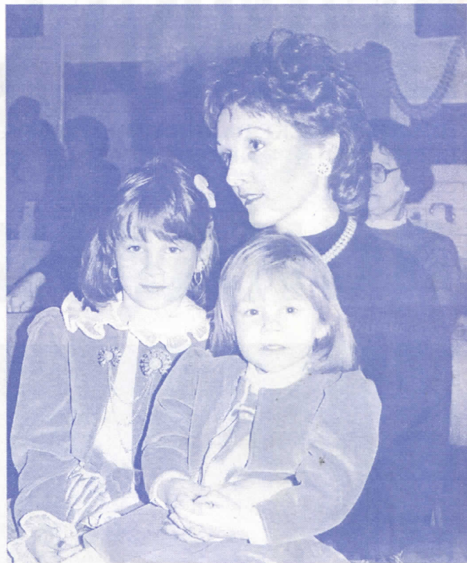
Узорна мајка и суйруџа

Рођена и одрасла на Чукарици у поштеној радничкој породици, одличан ученик XIII београдске гимназије, узоран студент, поштован радник. Носилац многобројних