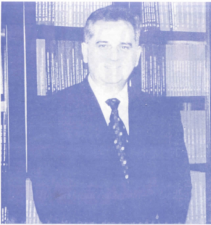
Победиће најбољи: Томислав Николић