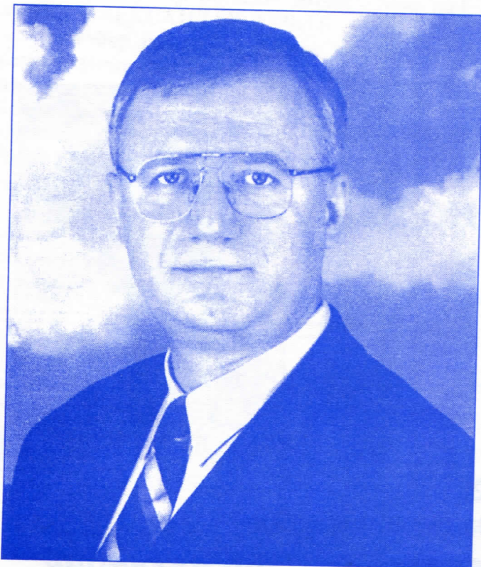
Председник Српске радикалне странке Др Војислав Шешел