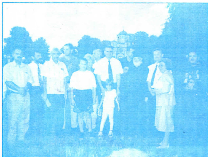
Томислав Николић са народом у манастиру у Сомбору

Српска радикална странка ће у циљу још већег афирмисања свих видова спорта у нашој општини битно повећати постојећи извор средстава и стимулације.