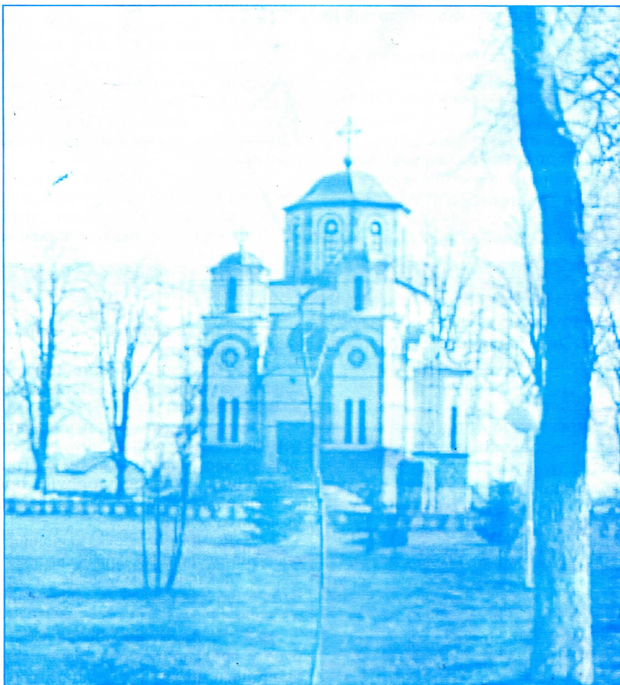
Манастир Св архијакона Стефана обновљен добровољним радом српских радикала

СРПСКА РАДИКАЛНА СТРАНКА СРПСКА РАДИКАЛНА СТРАНКА СРПСКА РАДИКАЛНА СТРАНКА СРПСКА РАДИКАЛНА СТРАНКА СРПСКА РАДИКАЛНА СТРАНКА СРПСКА РАДИКАЛНА СТРАНКА СРПСКА РАДИКАЛНА СТРАНКА СРПСКА РАДИКАЛНА СТРАНКА СРПСКА РАДИКАЛНА СТРАНКА