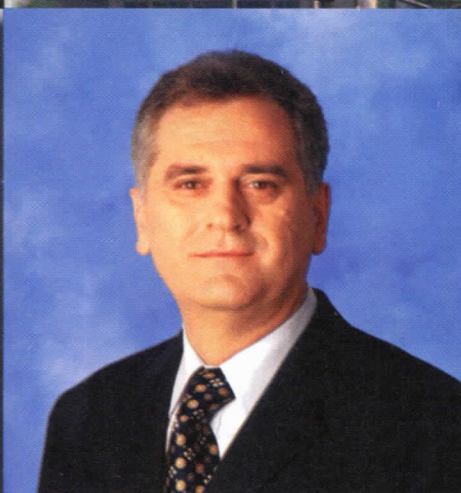
ТОМИСЛАВ НИКОЛИЋ КАНДИДАТ ЗА ПРЕДСЕДНИКА СР ЈУГОСЛАВИЈЕ