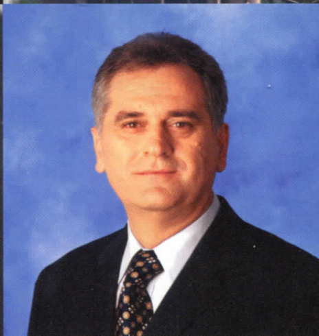
ТОМИСЛАВ НИКОЛИЋ КАНДИДАТ ЗА ПРЕДСЕДНИКА СР ЈУГОСЛАВИЈЕ