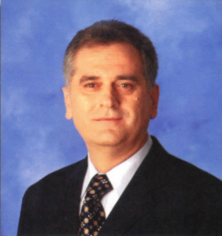
ТОМИСЛАВ НИКОЛИЋ КАНДИДАТ ЗА ПРЕДСЕДНИКА СР ЈУГОСЛАВИЈЕ