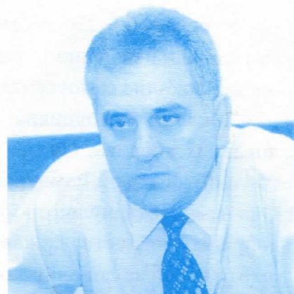
ТОМИСЛАВ НИКОЛИЋ ЗАМЕНИК ПРЕДСЕДНИКА