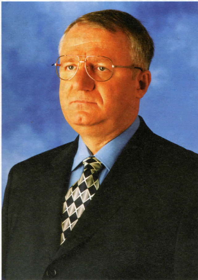
Председник Српске радикалне странке Др Војислав Шешељ