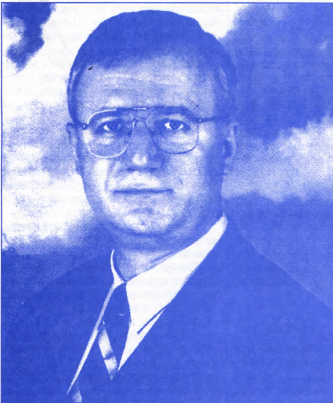
Председник Српске радикалне странке Др Војислав Шешељ