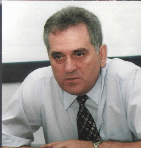
ТОМИСЛАВ НИКОЛИЋ КАНДИДАТ ЗА ПРЕДСЕДНИКА